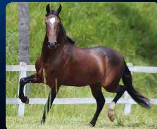
SEU AVÔ COMPLETO D2

SEXO: MACHO NASC: 19/11/2018 VENDEDOR: HARAS RIO FORTE