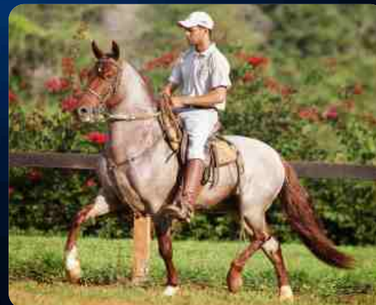
SEU PAI QUEBRUTO ELFAR