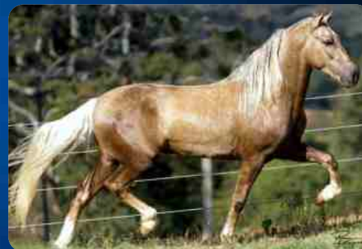
PRENHA DO QUOCIENTE ELFAR

SEXO: FÊMEA REGISTRO: 147733 NASC: 25/11/2013 VENDEDOR: HARAS GT