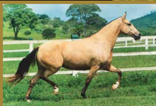
Sua avó Hortelã da Visão