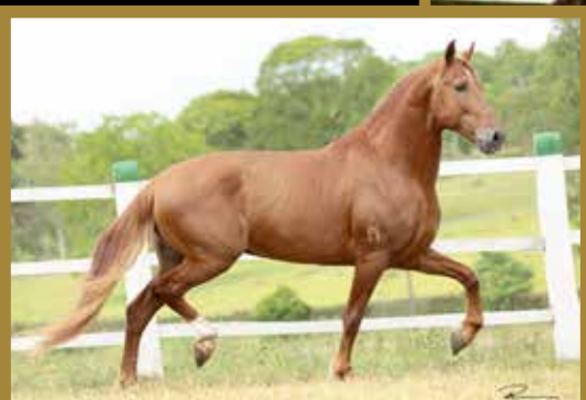
Seu pai Legat E.A.O.