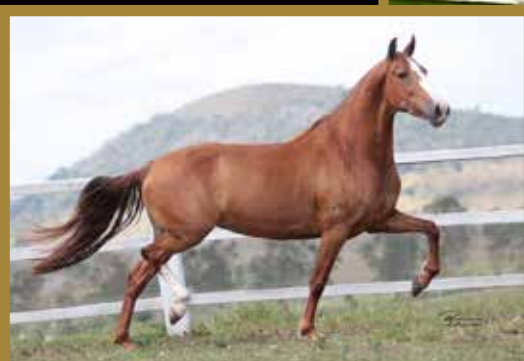
Sua mãe Alegria do Círculo D