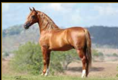
ESTANHO DE ALCATÉIA