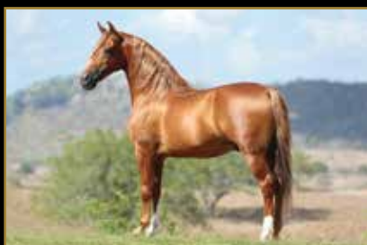
ESTANHO DE ALCATÉIA