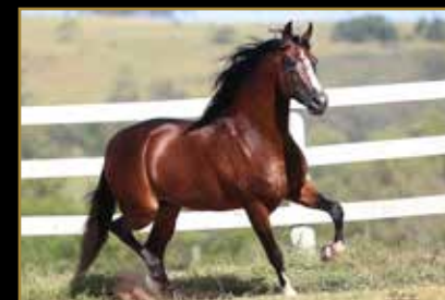
LÚCIDO DA FIGUEIRA