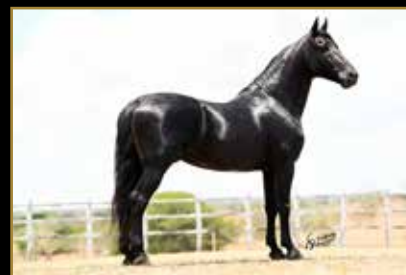
AZTECA DO PORTO PALMEIRA