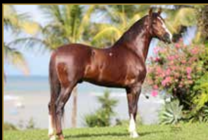
TRILHO DO PORTO AZUL