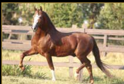
GALANTE DO EXPOENTE