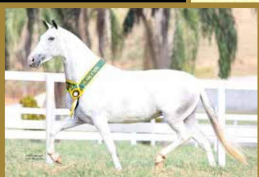
Sua irmã Sininho Bavária