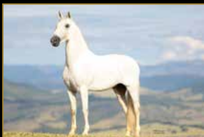
MAGNÍFICO DA CORTE