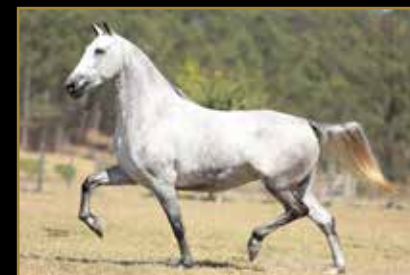
SUA FILHA JUVENTUDE L2