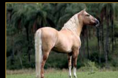
FATOR DA CAVARÚ-RETÃ