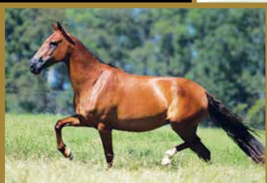
Sua mãe Sapoti do Aeroporto