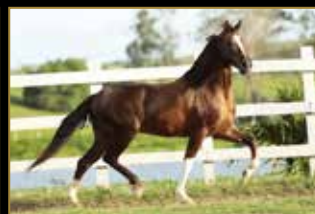
MONARCA DE ALCATÉIA