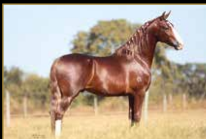
ATREVIDO DA MORADA NOVA