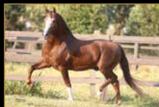
GALANTE DO EXPOENTE