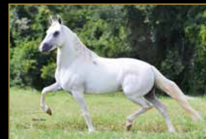
SHAKE EL FAR