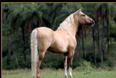
FATOR DA CAVARÚ-RETÃ