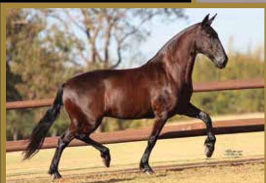
Sua filha Quina da Santa Esmeralda