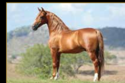
ESTANHO DE ALCATÉIA