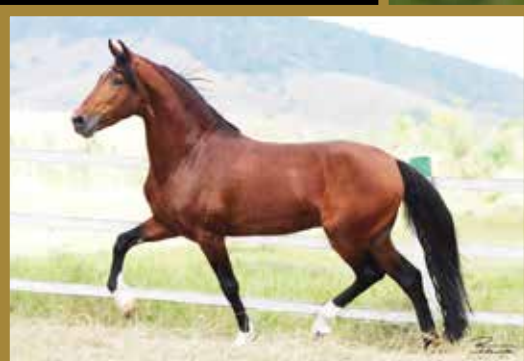
Seu avô Emblema E.A.O.