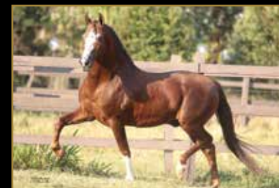
GALANTE DO EXPOENTE