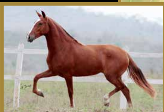
Sua mãe Lambada Porteira Azul