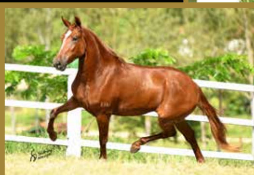
Sua mãe Superação E.A.O.