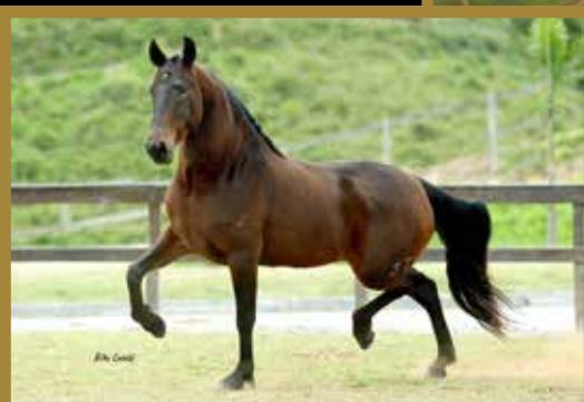
Sua irmã Própria Sapucaí do Porto Palmeira