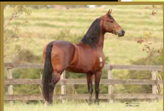
Seu pai Dínamo do Conforto