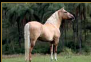
FATOR DA CAVARÚ-RETÃ