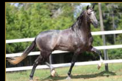
JUÍZ DE ALCATÉIA