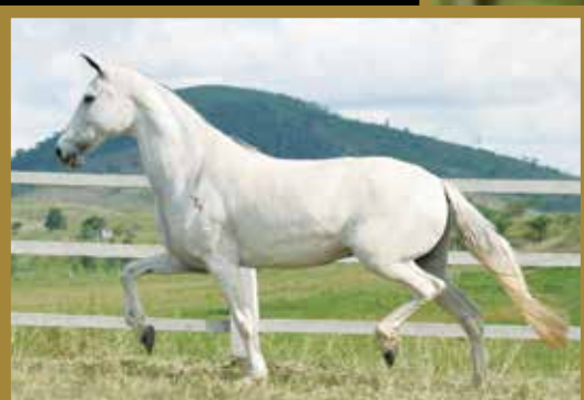
Sua mãe Favacho Dama