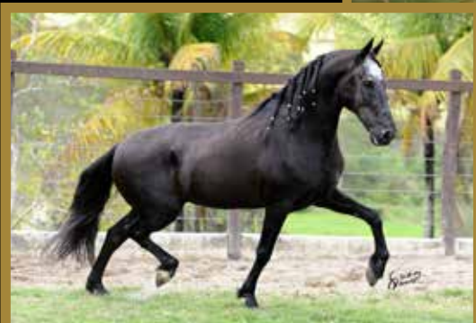
ELFO DO PORTO AZUL