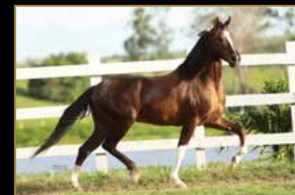
MONARCA DE ALCATÉIA