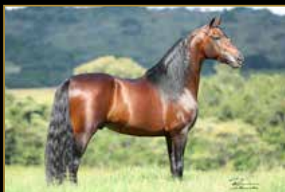
FORRÓ DO ARO