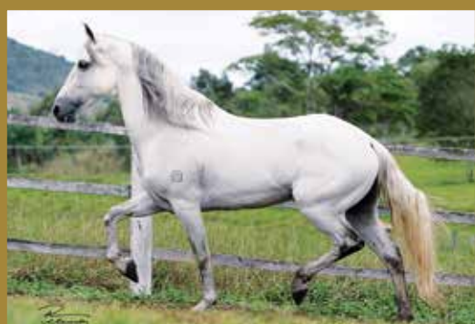
Seu avô Baluk de Malta