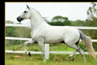
RAÇA PURA E.A.O.