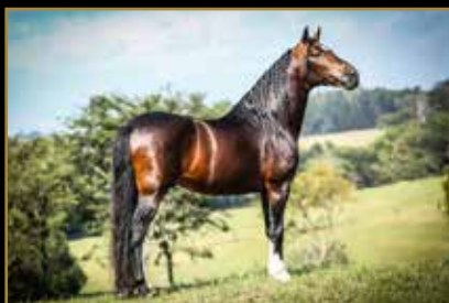
LÓTUS DA CATIMBA