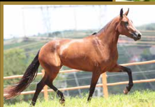
Sua mãe Mangaba Porteira Azul