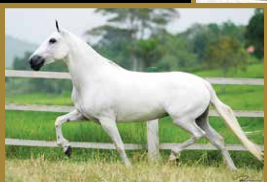
Sua mãe Nata da Visão