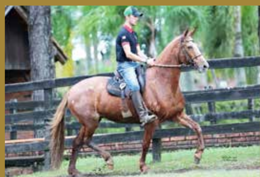
Sua avó Moeda JB