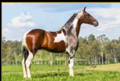
FALCÃO DO ZEL