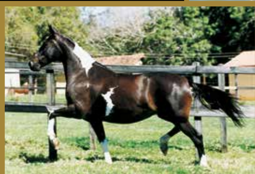
Sua mãe Mutreta da Ogar