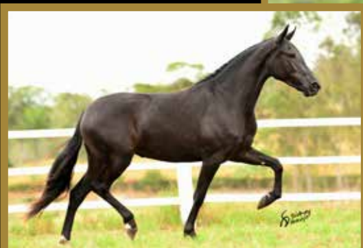
Sua filha Udinese E.A.O.