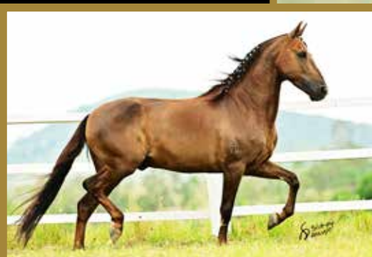
Seu pai Plutão E.A.O.