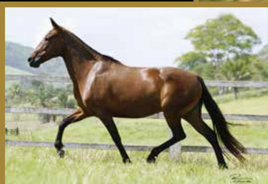
Sua avó Cristal Rancho Brasil