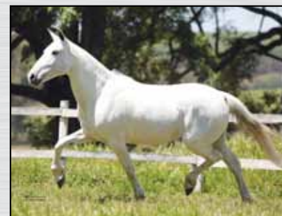
15. FAVACHO RADIOLA - 50%