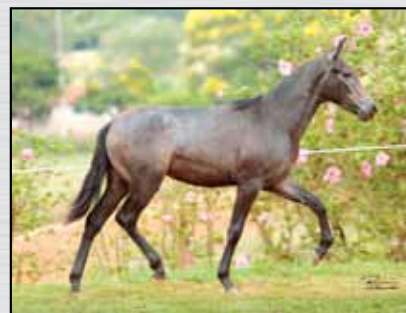
28. LULU DE ANGLISA - 50%