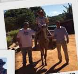
CTE Boa Esperança