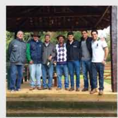
Haras e Fazenda do Salto