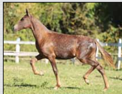
09. CAXAMBU JORNALISTA - 50%