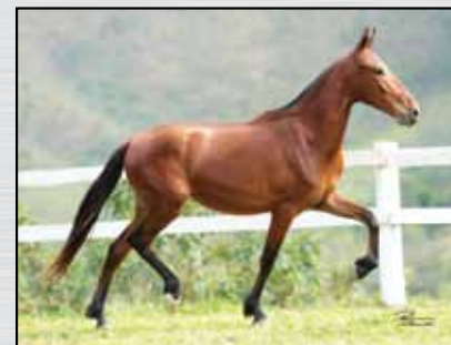
10. CINERAMA JEA