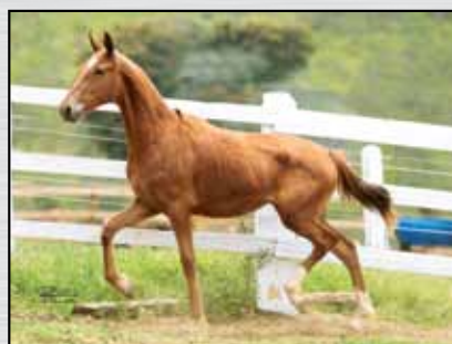
16B. FORTUNA GN