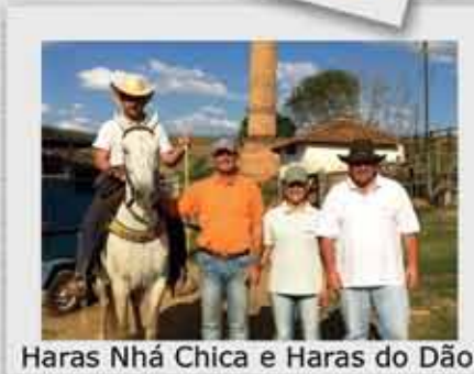
Haras Nhá Chica e Haras do Dão