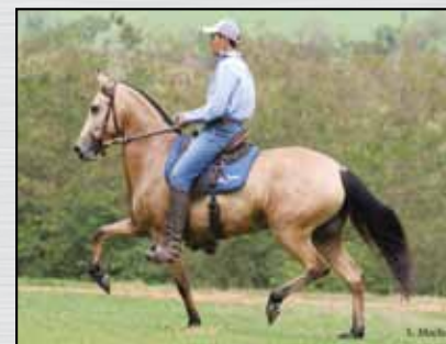
29. LUZ HR - 50%