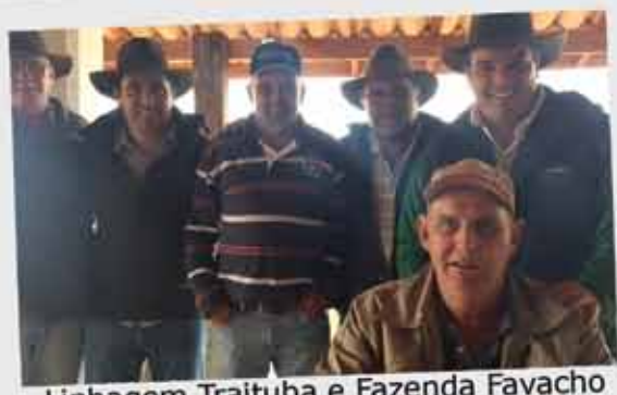
Linhagem Traituba e Fazenda Favacho