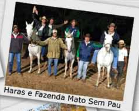
Haras e Fazenda Mato Sem Pau