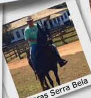
Haras Serra Bela