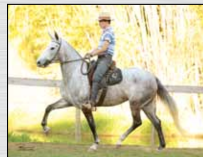
39. RESSACA DA CABEÇA BRANCA