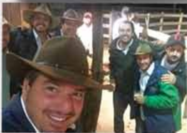
Haras Mato Limpo e Mato Verde