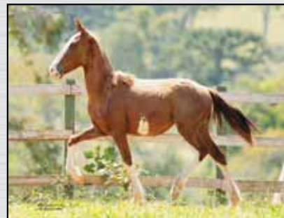
04. ANGAI RELVA