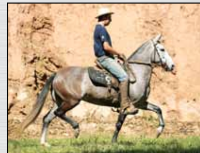
05. ARA AFRODITE