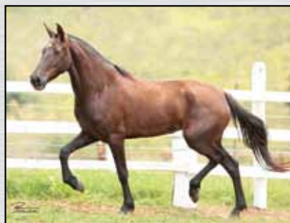
27. LORENA MORRO GRANDE DA ZIZICA