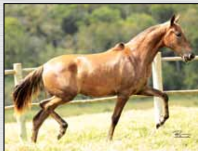
07. BOÊMIA SERRA BELA