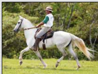
12. COPA MORRO GRANDE DA ZIZICA - 50%