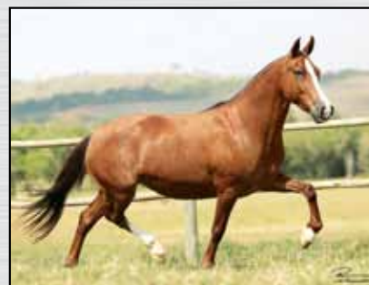
38. REQUEBRA GAMARRA