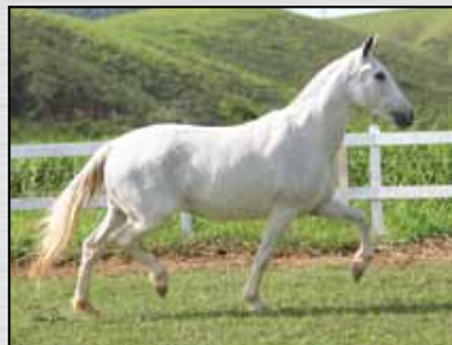
02. ANGAI TATUAGEM - EMBRIÃO