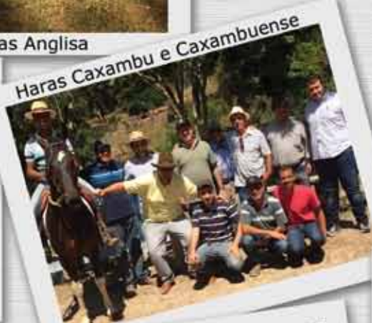
Haras Caxambu e Caxambuense