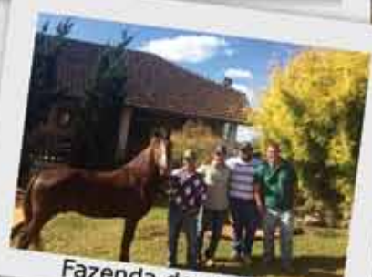
Fazenda dos Lobos