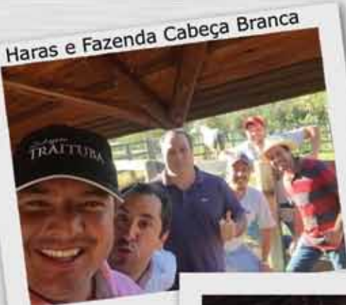
Haras e Fazenda Cabeça Branca