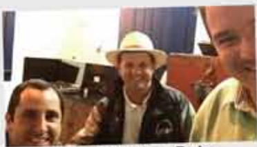
Haras Serra Bela