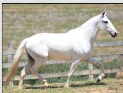
20. HERANÇA DO BARREIRO