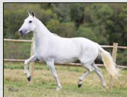
14. EMOÇÃO DAS MINAS GERAIS