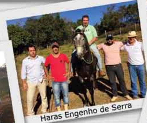
Haras Engenho de Serra