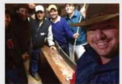
Haras Rancho Pampa