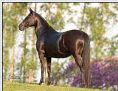
32. MISS SOMERLAT