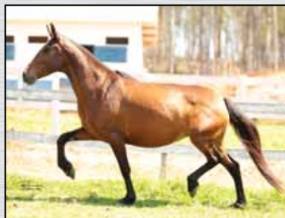
08. CAPITU DO NARCISO SJ - 50%