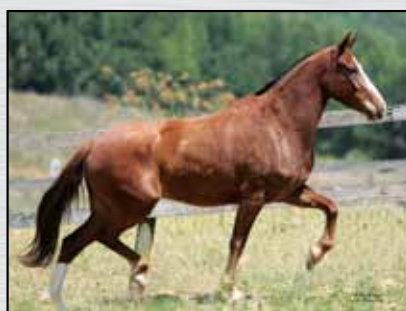
22. HONRA DO BARREIRO