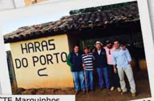
Haras do Porto