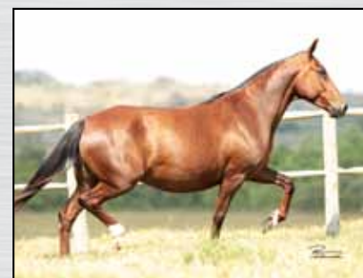
19. HÉLICE DAS MINAS GERAIS