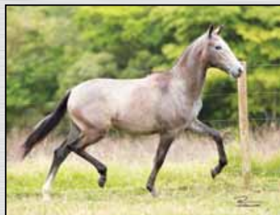
31. MANTEIGA DO MATO VERDE - 50%