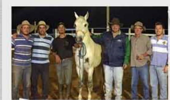
Haras Barao de Alfenas