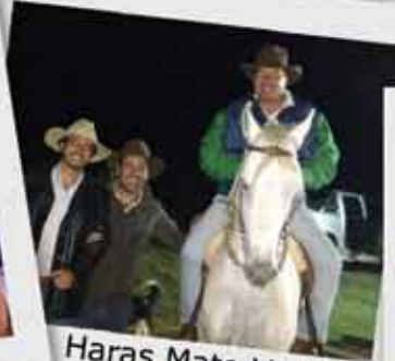
Haras Mato Verde