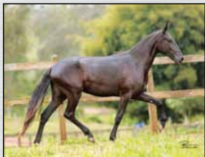
30. MALVADA DA JAK - 50%