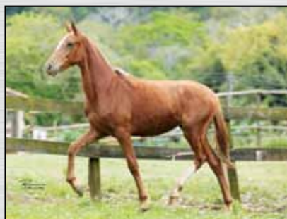
13. DIVA SANTA NHÁ CHICA - 50%