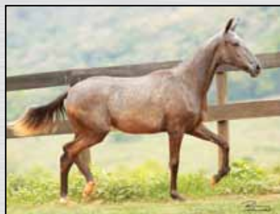
26. KERMESE PRIMAVERA - 50%