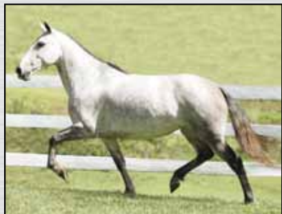
01. GUITARRA DO AEROPORTO - EMBRIÃO