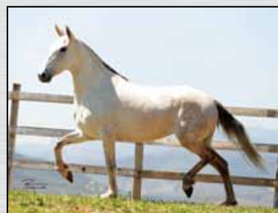
18. GRAFITE BETA - 50%