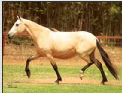
03. ANDALUZA DO SALTO - 50%