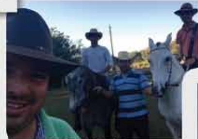
CTE Nhá Chica