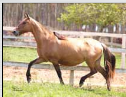
41. URIRI DO PINHÃO ROXO