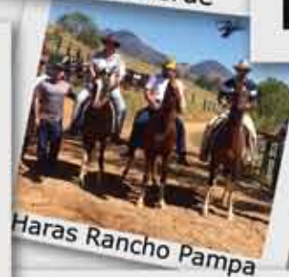
Haras Rancho Pampa