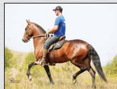
24. JEITOSA DAS MINAS GERAIS - 50%