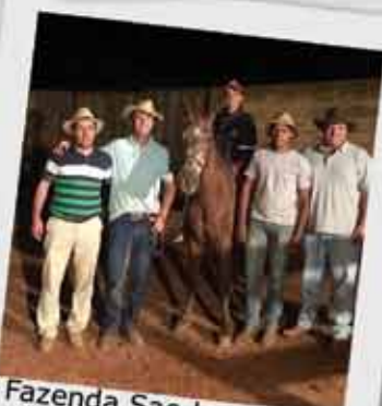
Fazenda Sao Lourenco