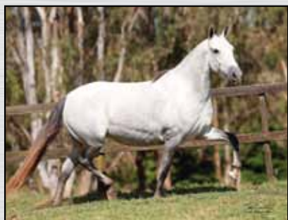
35. NORREMOSE FAENA