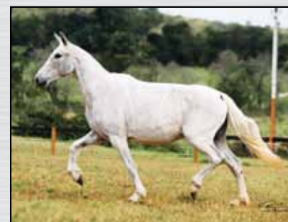
45. XANTINA EDU