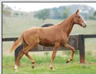
36. QUITANDA DE SÃO LOURENÇO