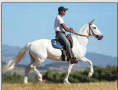
40. TRAITUBA DINASTIA - 50%