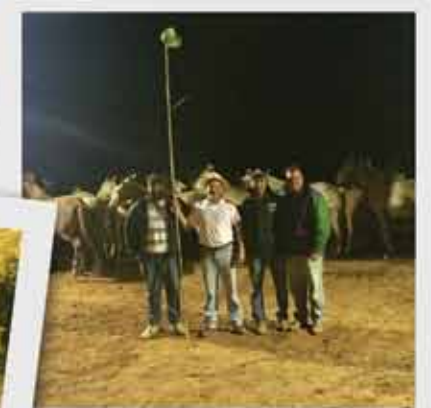
Fazenda Bela Cruz