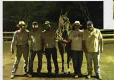
Haras El Far