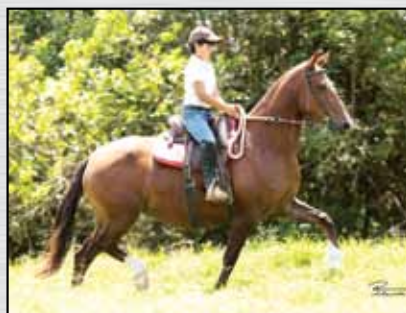
37. RAPOSA DO ENGENHO DE SERRA - 50%