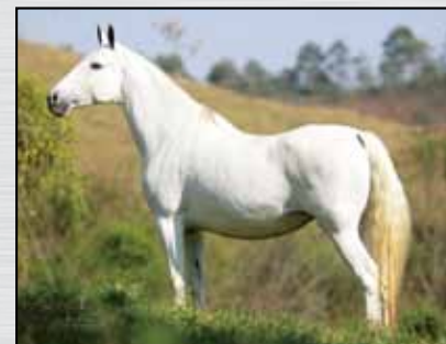
34. NAJA DA SANTA ESMERALDA