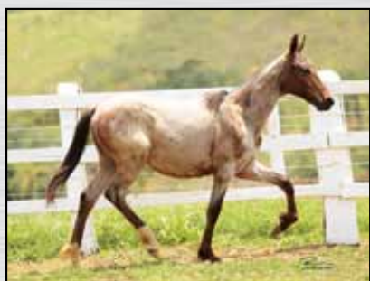
16A. FIRENZE GN