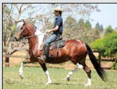
21. ITAQUI CANDIDATA - 50%