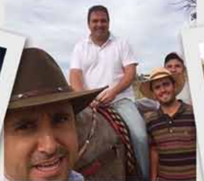
Haras Origem e JLL