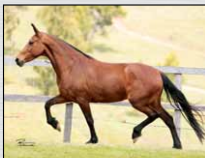
42. VENEZA JB - 50%