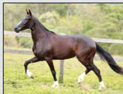
43. XAMA EL FAR - 50%