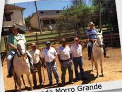
Fazenda Morro Grande