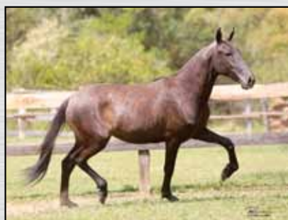
17. GAZELA DO PORTO