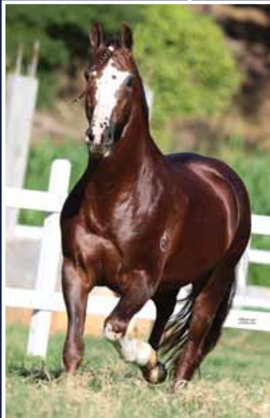
Galante do Expoente