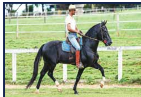
Sertão Elfar Data 03/12/2014 Receptora: 135