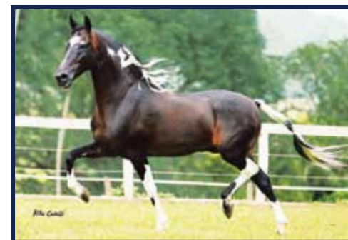
Sublime da Ogar