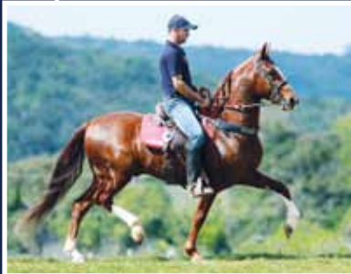
Caçador da Selva Morena