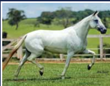
Guaripocabana da Santa Esmeralda