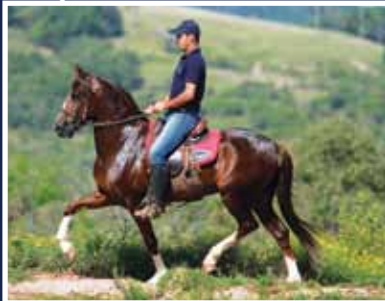
Garibaldi do Expoente