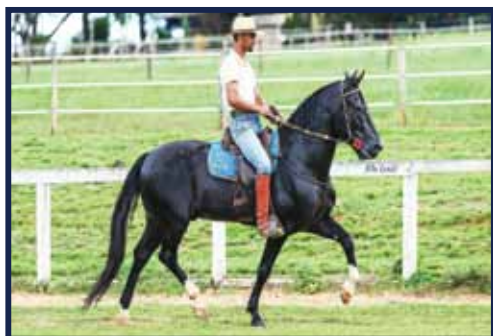
Sertão Elfar Data 11/11/2014 Receptora: 210