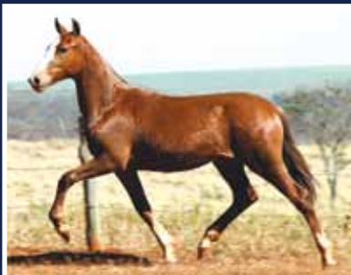
Pátria da Selva Morena