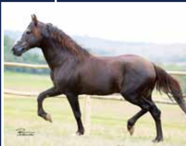
Trilho da Zizica