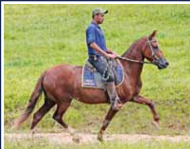
Luma do Cartel