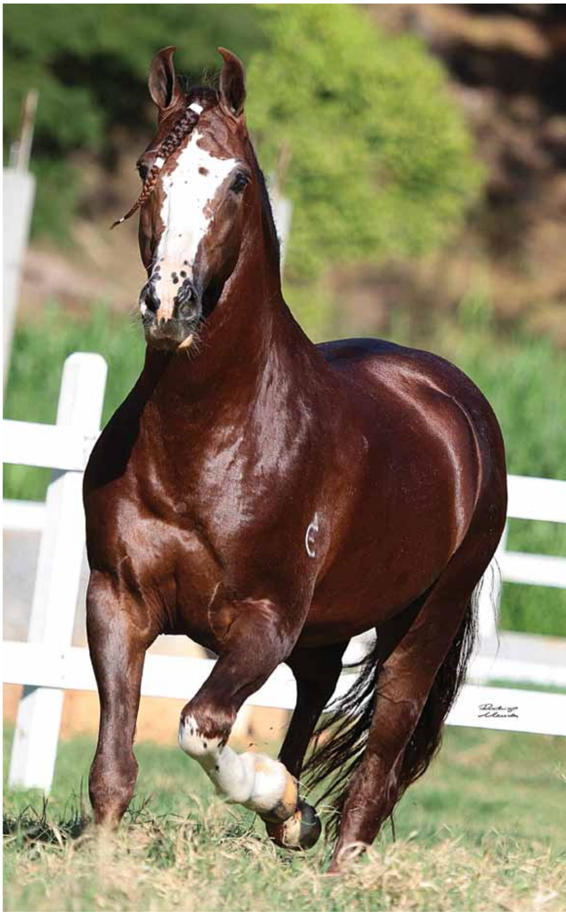
Trilho da Zizica x Única Kafé