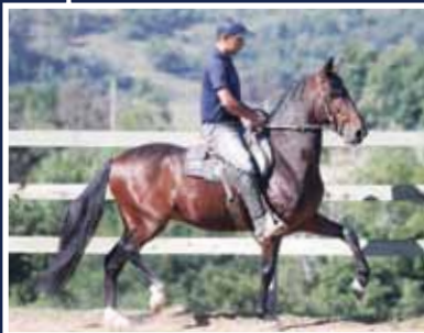
Galileu do Expoente