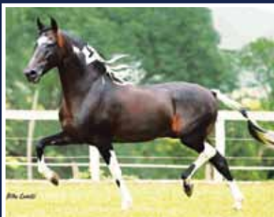
Sublime da Ogar