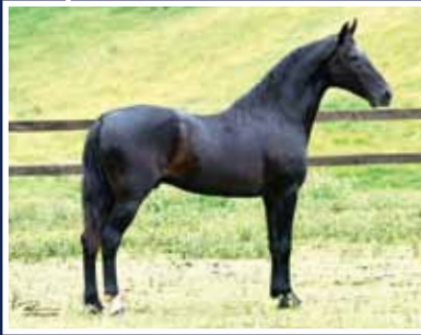
Festival da Ogar