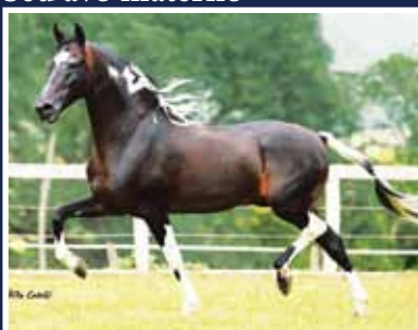
Sublime da Ogar