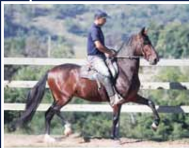
Galileu do Expoente