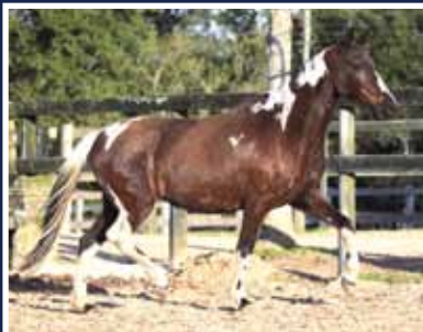
Fagulha do Expoente