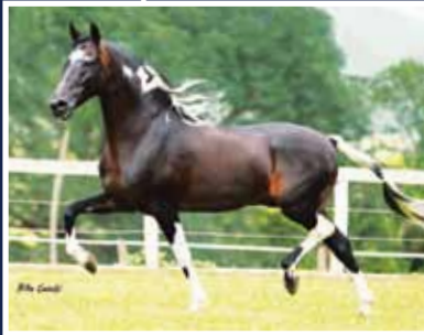
Sublime da Ogar