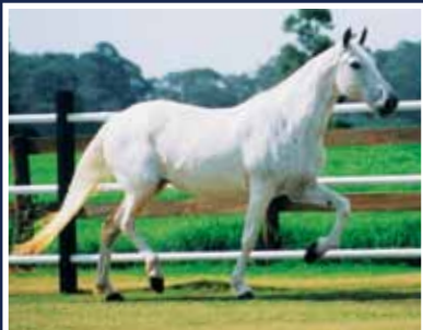
Nêspira da Esperança