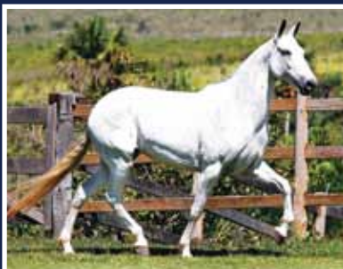
Gaúcha Traituba JF