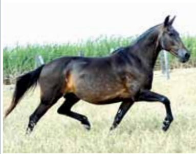
Imperatriz de Ituverava