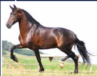
Radar de Anchieta