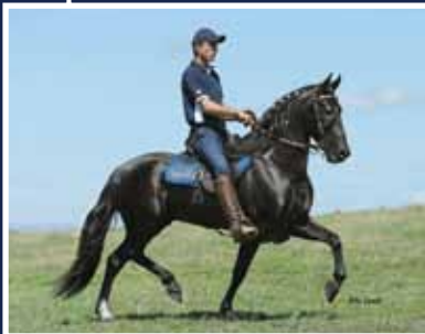
Gavião do Lumiar