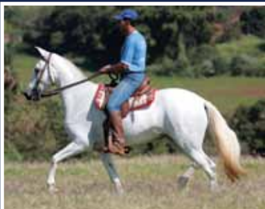
Fábula da Esperança