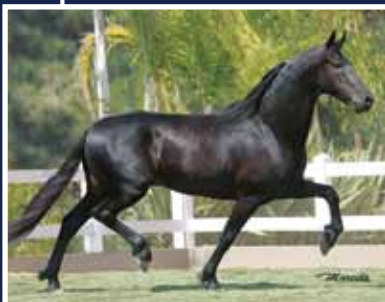
Koliseu do Morro Azul