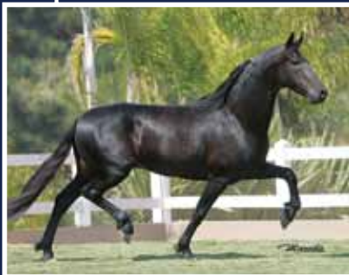
Koliseu do Morro Azul