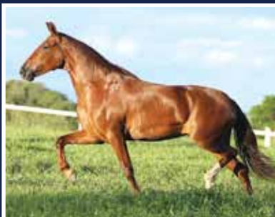
Roseira do Passo Fino