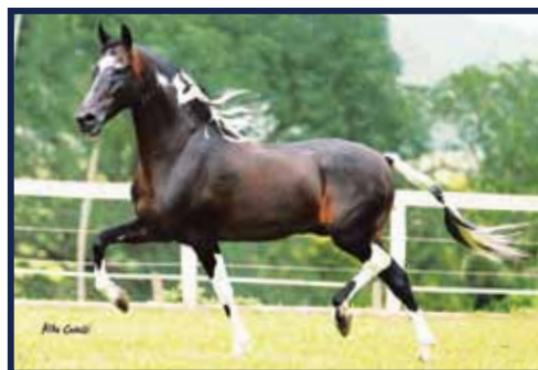
Sublime da Ogar