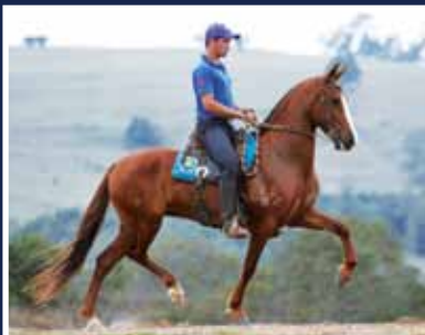
Flor do Expoente