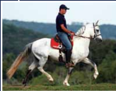
Herdeiro do Expoente