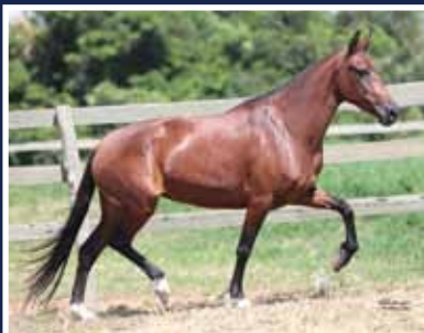
Flexa da Figueira