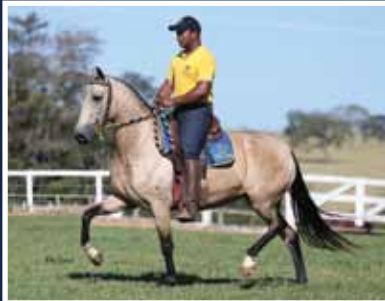
Diva da Santa Vitória