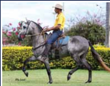
Zap da Santa Vitória