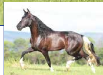
Aimoré do Porto Palmeira

Linda, femina, eguaça, castanha! Seu pai foi o Campeão Nacional Progênie de Pai na última Fenagro e sua mãe já foi campeã nacional montada. Vai com prenhes positiva do jovem reprodutor preto pampa, Aimoré do Porto Palmeira, um irmão próprio do Grande Campeão Nacional da Raça e Campeão dos Campeões Nacional de Marcha – Trapiche do Porto Palmeira.