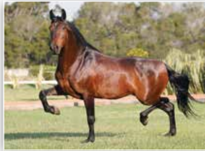
SEU PAI RINGO DO CÍRCULO D