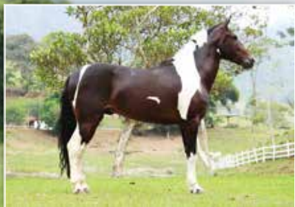
PAI DA POTRA ITAQUI BARALHO