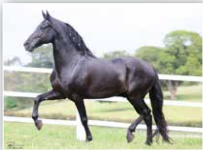
SEU PAI FÉ EAO