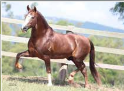
SEU PAI GALANTE DO EXPOENTE