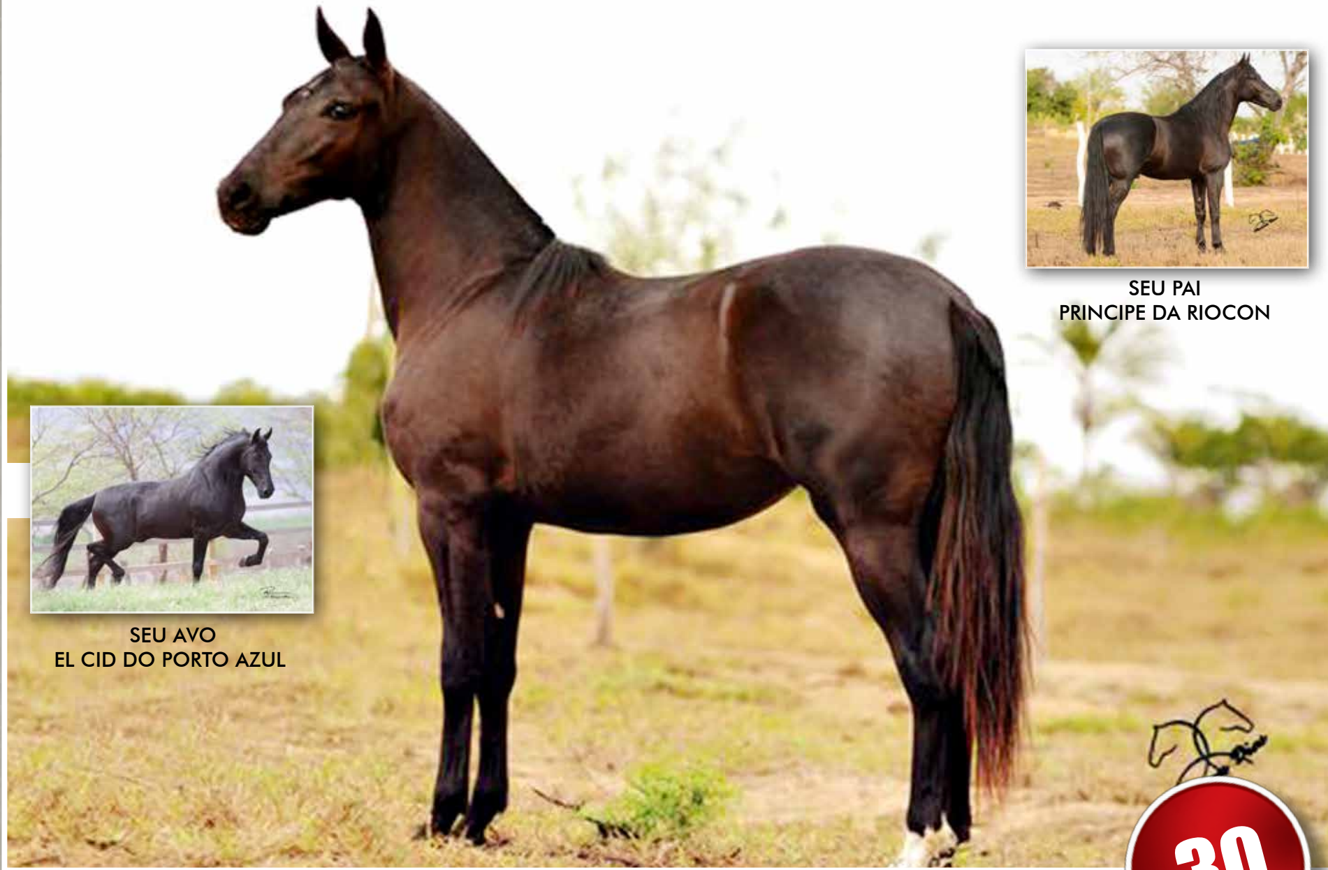
SEU PAI PRINCIPE DA RIOCON