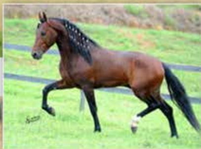
SEU IRMÃO MATERNO PÉ DE OURO DA RIOCON