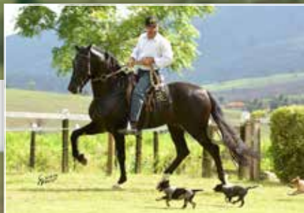
PRENHEZ POR KADAR EAO