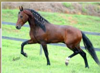
SEU IRMÃO MATERNO PÉ DE OURO DA RIOCON