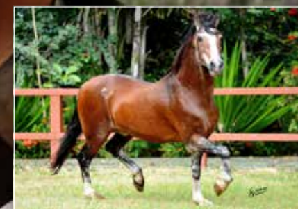
SEU AVÔ FAVACHO ÚNICO