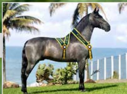
PRENHEZ POR ESTÂNCIA ARCO-IRIS ABOIO