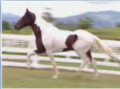
SEU PAI CAPRICO GOLDEN HORSE