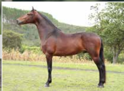
SEU PAI POETA DA RIOCON