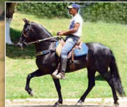
PAI DA POTRA E DA PRENHEZ SUMARÉ VIAGRA