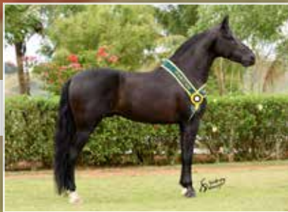
SEU PAI KADAR EAO