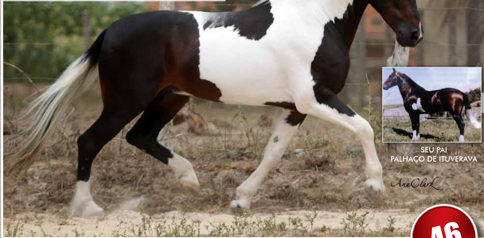
SEU PAI PALHAÇO DE ITUVERAVA

Campeão Cavalo Júnior de Marcha – Paracatu 2008 Res. Campeão Cavalo Júnior de Marcha – Brasília 2008 Campeão Cavalo Júnior - Marcha Picada – Patos De Minas 2009 Res. Campeão Cavalo Júnior de Marcha – Uberlândia 2009 Campeão Cavalo Jovem de Marcha – Brasília 2001 Res. Campeão Cavalo Jovem de Marcha – Laranjeiras 2013 Campeão Adulto Cavalo Adulto Categoria – Aracaju 2014 Res. Campeão Cavalo Adulto – Aracaju 2014 Res. Campeão Nacional Cavalo Adulto de Marcha – Belo Horizonte 2008 Res. Campeão Nacional Cavalo Sênior - Marcha Picada – Belo Horizonte 2009