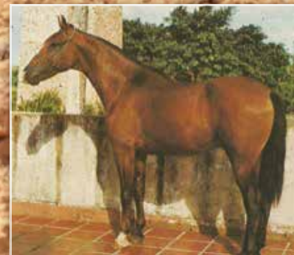
SEU AVÔ HERDADE CAPRICHÔ