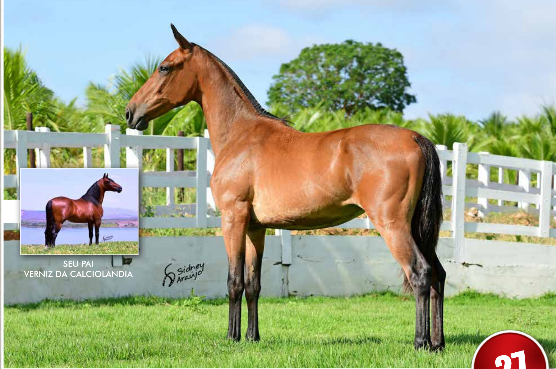
SEU PAI VERNIZ DA CALCIOLÂNDIA