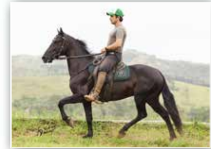
SEU PAI ÉBANO DA DONMA JÓ