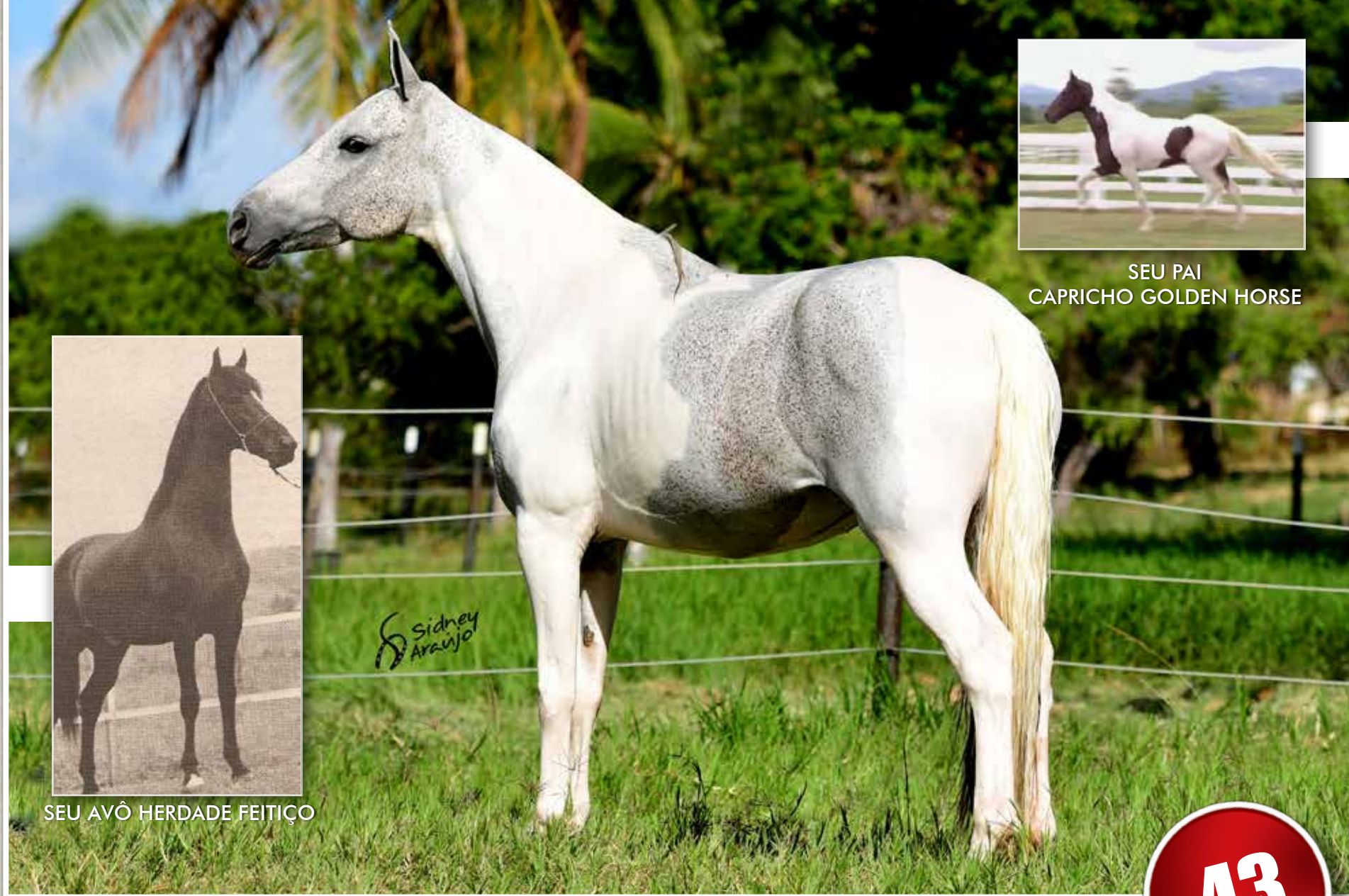
SEU PAI CAPRICO GOLDEN HORSE