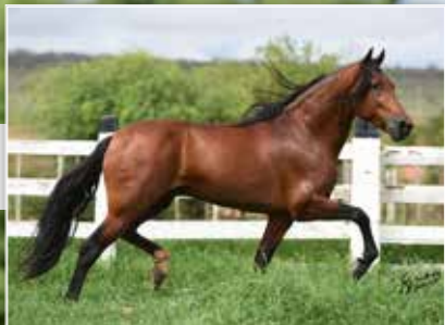
SEU PAI LUXO DE MAIRI