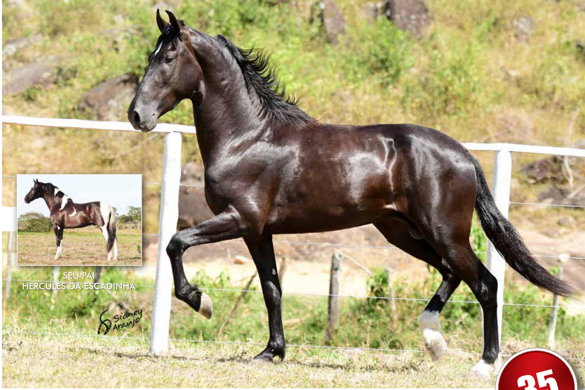
SEU PAI HERCULES DA ESCADINHA