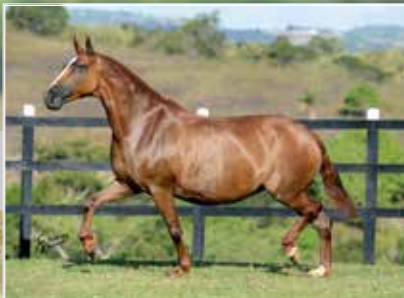
SUA AVÓ UPA KAFÉ