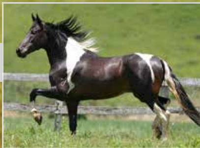
SEU AVÔ IMBU JOCAMAN