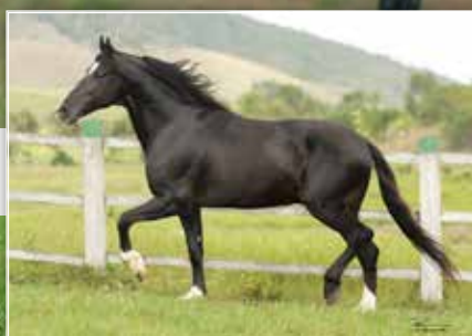
SEU AVÔ TURISTA DE SANTA LUCIA