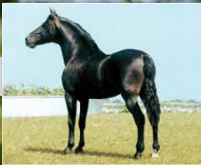
SEU AVÔ LAMPEÃO HO