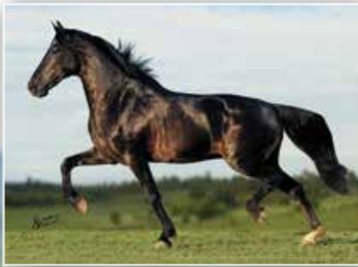
SEU AVÔ ELFO DO PORTO AZUL