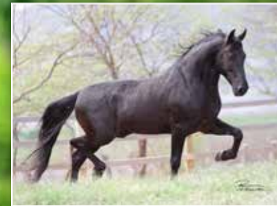
SEU PAI EL CID DO PORTO AZUL