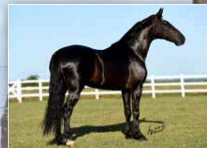
SEU AVÔ ELFO DO PORTO AZUL