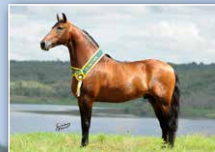
PRENHEZ POR NERO DE ITAPUAN