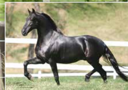
SEU AVÔ SEIKO LJ