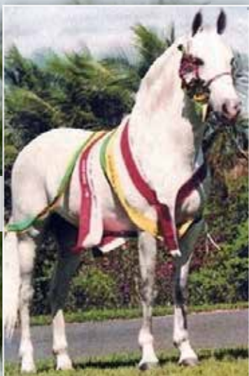
SEU AVÔ HERDADE NERO