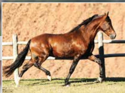
SEU PAI QUARTZO CAXAMBUENSE