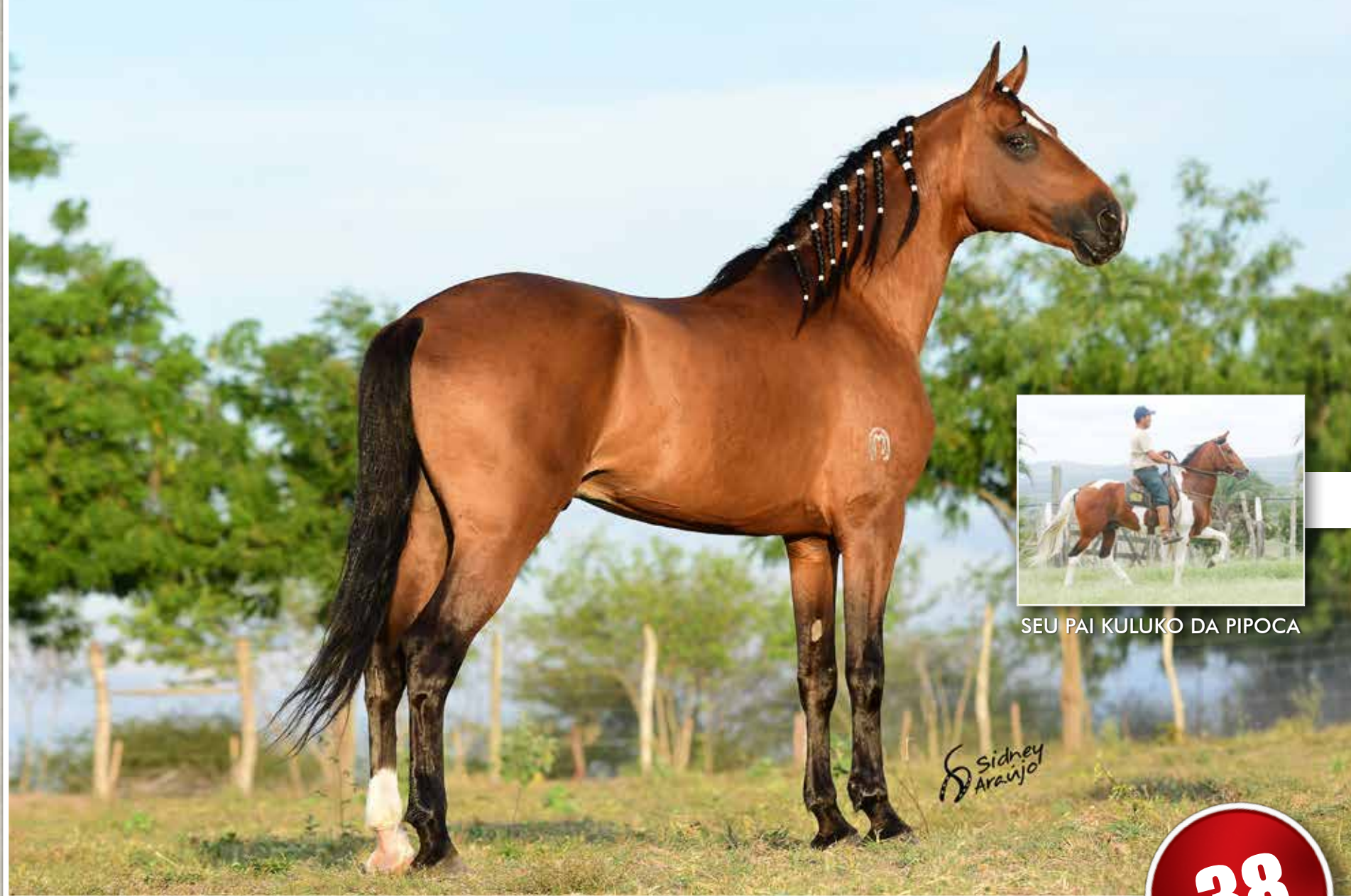
SEU PAI KULUKO DA PIPOCA