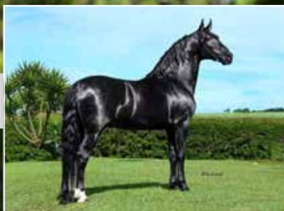
DIREITO A COBERTURA RIGOLETO JB