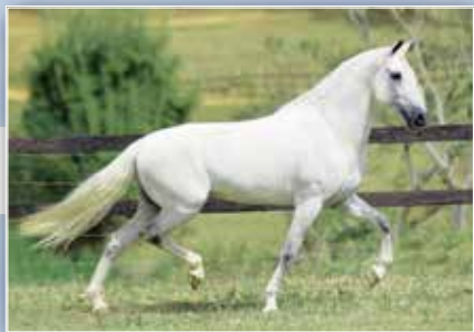
SEU AVÔ ABRIGO D2