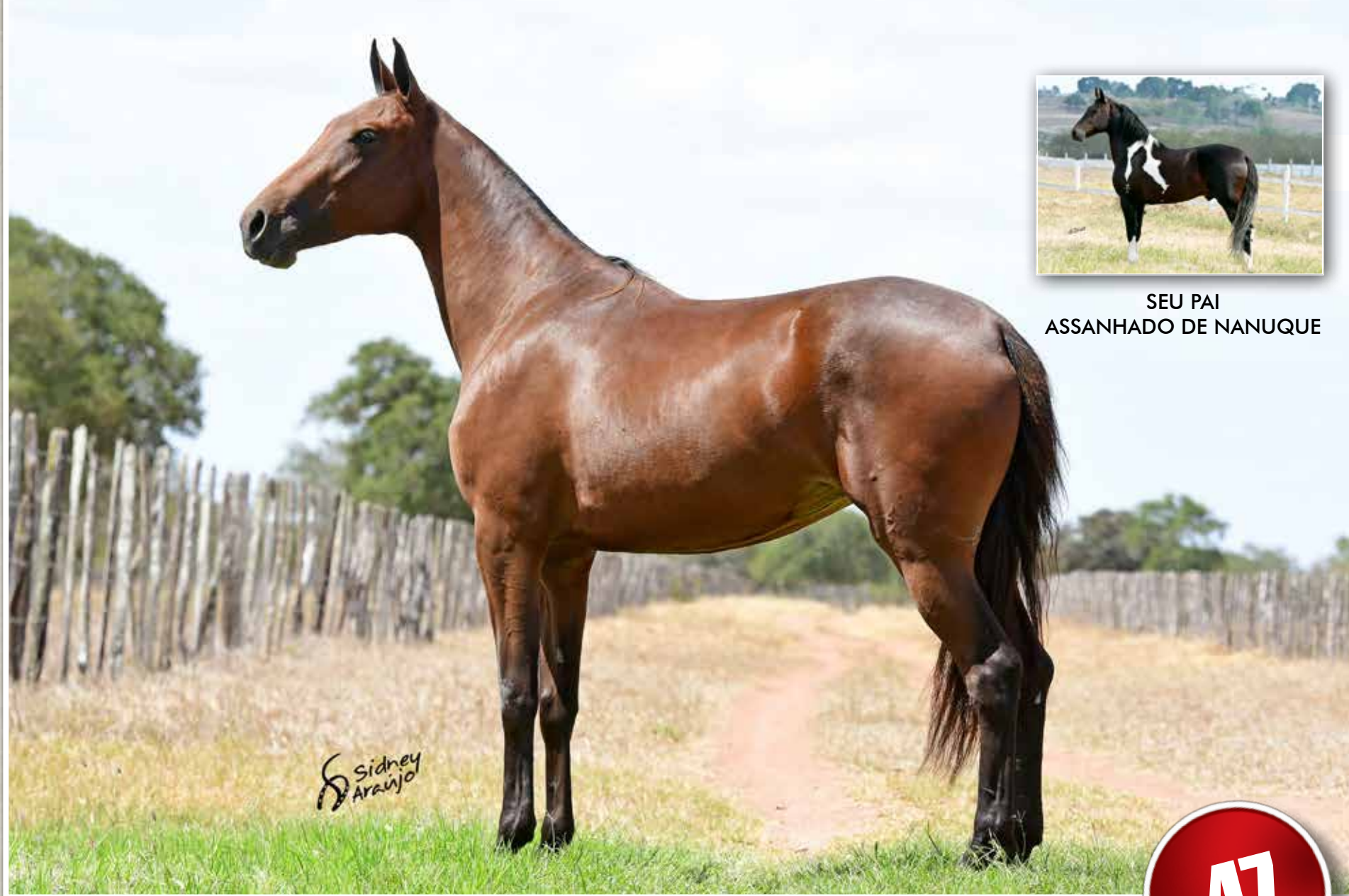
SEU PAI ASSANHADO DE NANUQUE