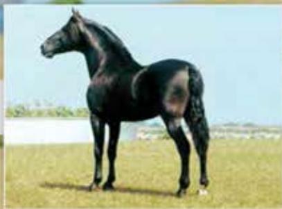
SEU PAI LAMPEÃO HO