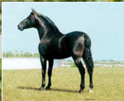
SEU PAI LAMPEÃO HO