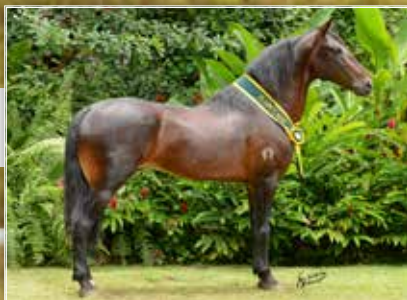
SEU TIO HERCULES DA EVOLUÇÃO