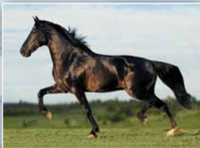
SEU PAI ELFO DO PORTO AZUL