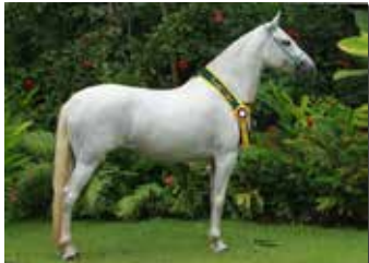
ALIANÇA DA COXILHA GRANDE