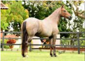
DEUSA DO CALULI