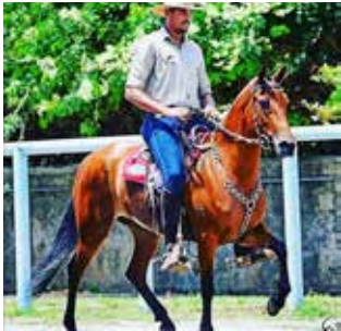
GAIATA DA LOUISE