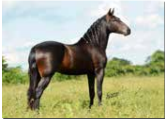
HEBREU DO CIRCULO D