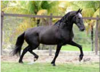
ELFO DO PORTO AZUL