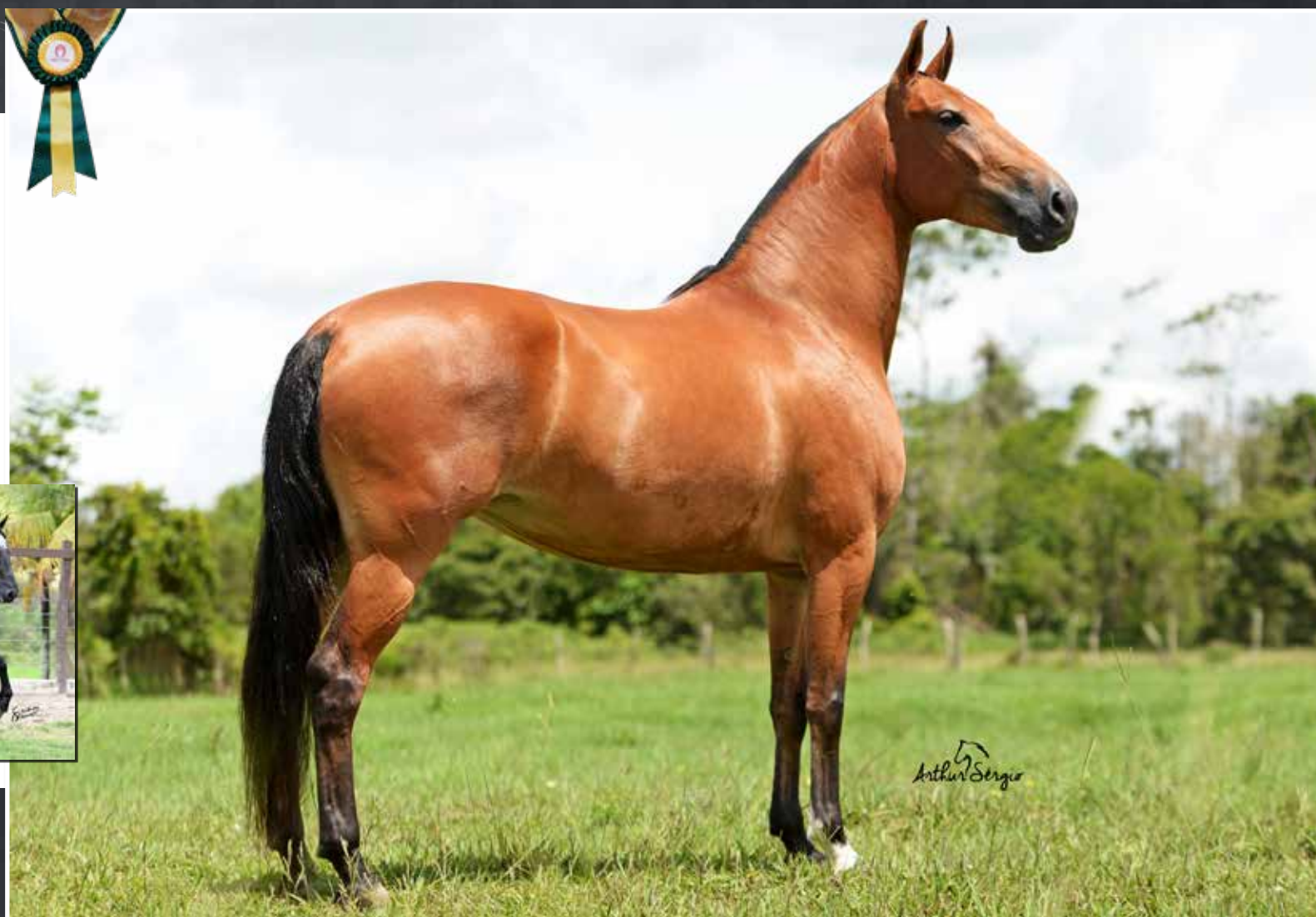
ELFO DO PORTO AZUL