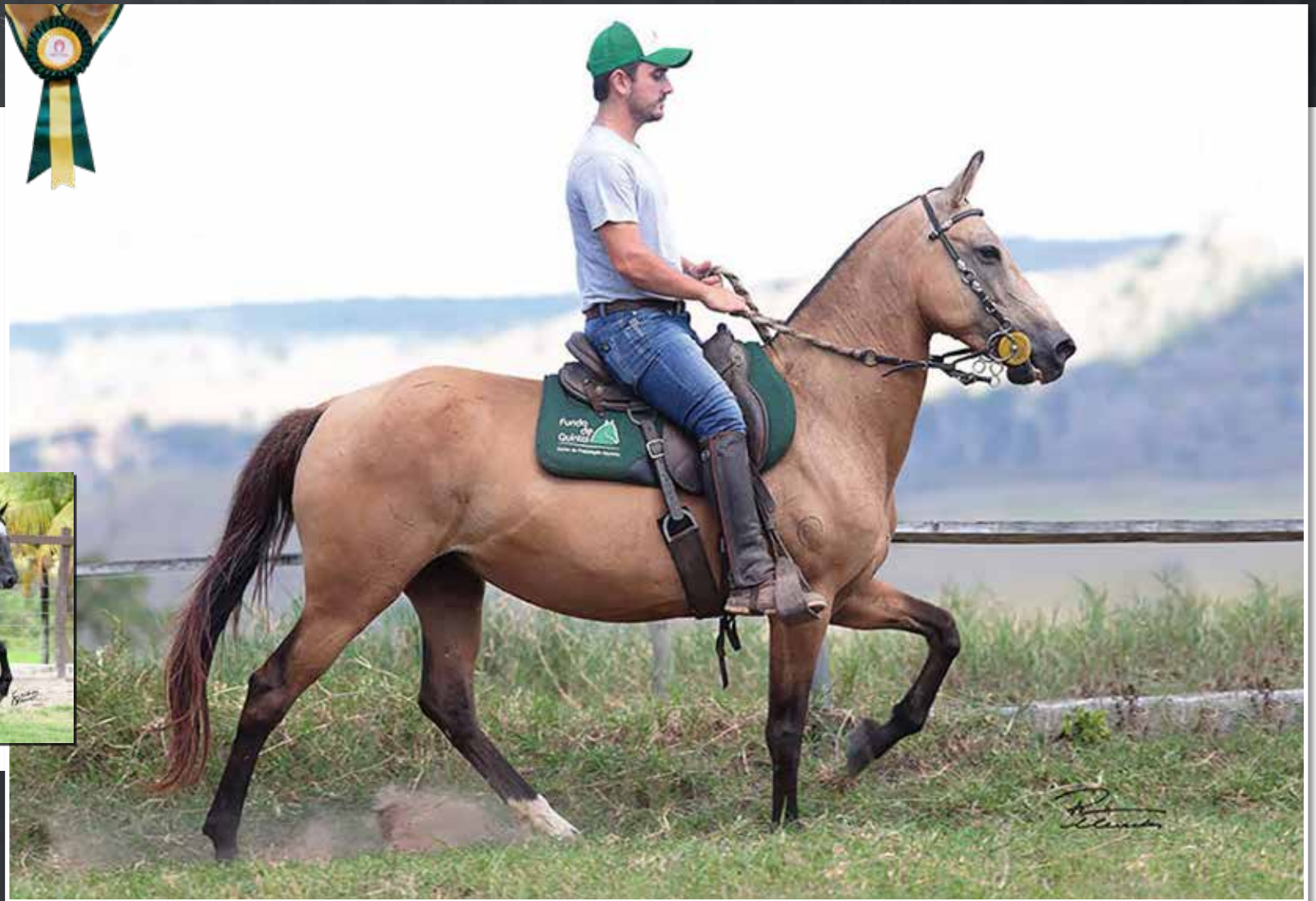
ELFO DO PORTO AZUL