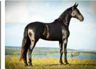
SEU FILHO ÚNICO BEIRA RIO POR ELFO