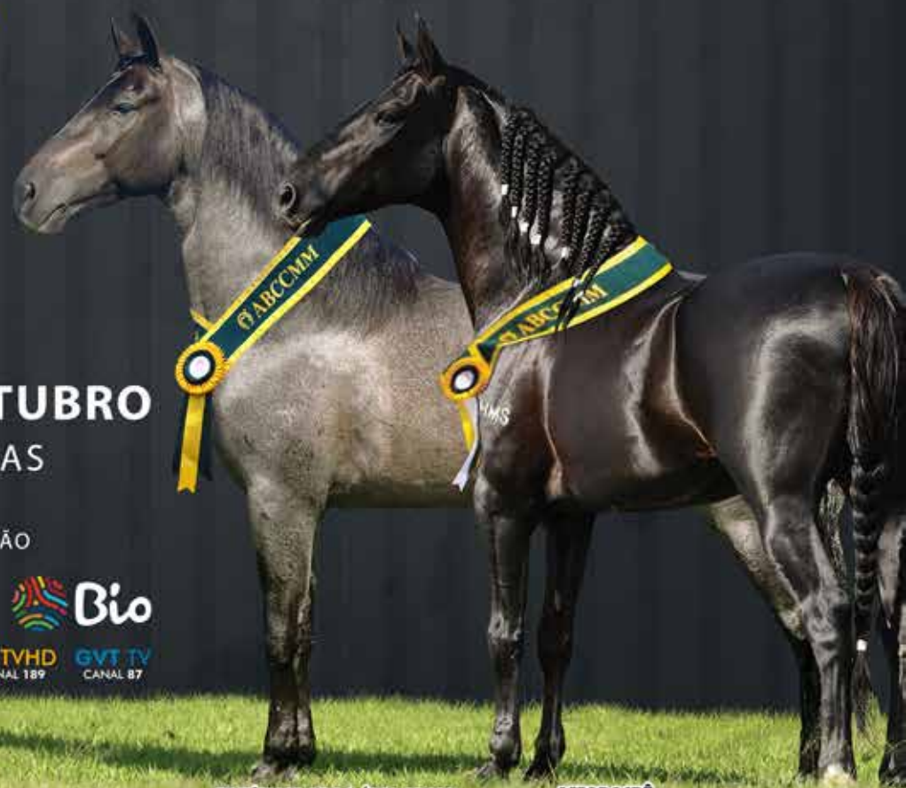
ESTÂNCIA ARCO-ÍRIS ABOIO