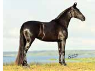
SUA FILHA FORTUNA BEIRA RIO POR ABOIO