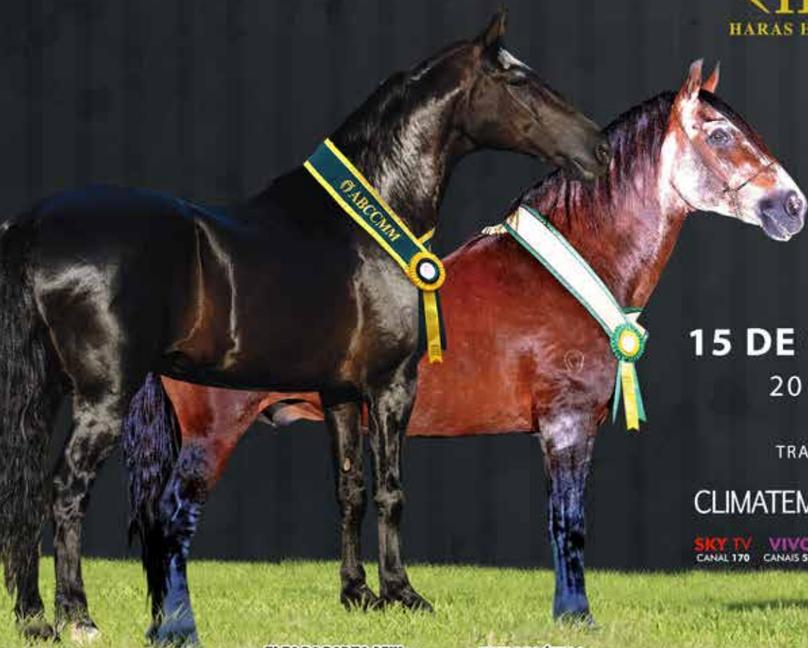
ELFO DO PORTO AZUL