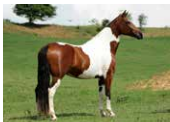
DAMA DO SÃO JORGE