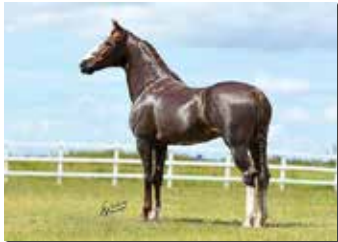
MUSSOLINI DA PEDRA VERDE