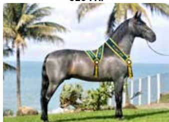
ESTÂNCIA ARCO ÍRIS ABOIO