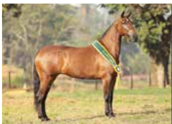
BARONEZA BEIRA RIO