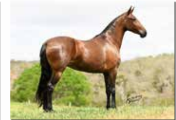
SUA FILHA NAJA BEIRA RIO POR ELFO