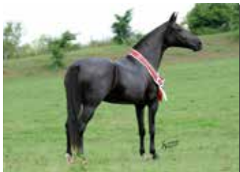
BAIANA DE JACOBINA