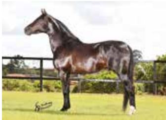
HERDEIRO DO MINATTO