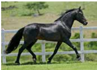
EMBAIXADOR DO PORTO AZUL