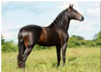
HEBREU DO CIRCULO D