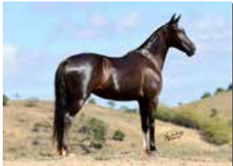
ITALIANA DO MONTEIRO