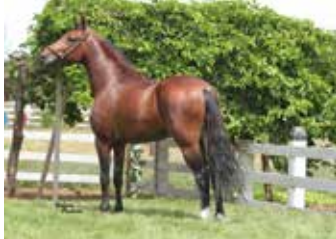
LUXO DE MAIRI