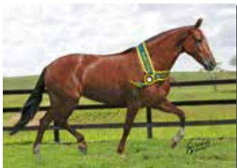
EVA DE ALCATÉIA