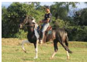
JUSTO DO PORTO AZUL