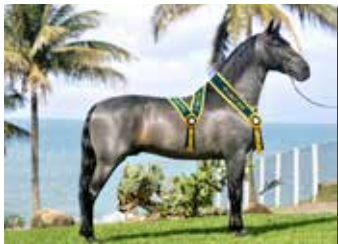
ESTIANCIA ARCO ÍRIS ABOIO