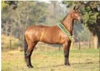
BARONEZA BEIRA RIO