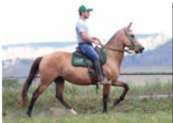
BAILARINA DO PERRELLA