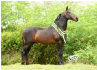
GAVIÃO DAS CARAÍBAS