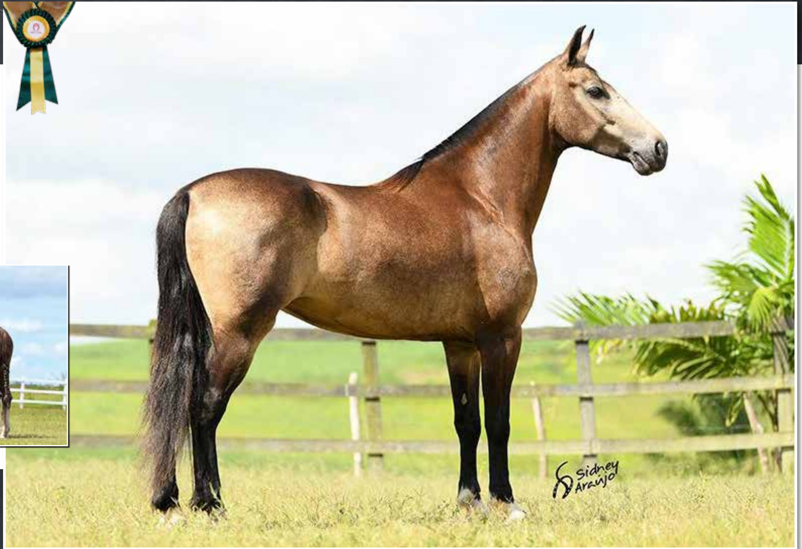
MUSSOLINI DA PEDRA VERDE