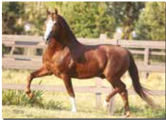
GALANTE DO EXPOENTE