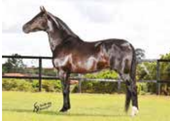
HERDEIRO DO MINATTO