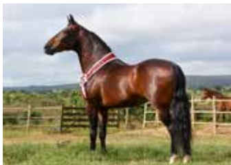
QUERUBIM DA BOA NOVA