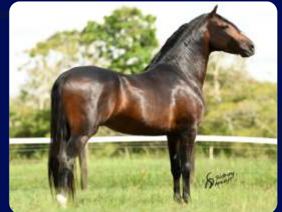
SEU PAI PATRIARCA DN