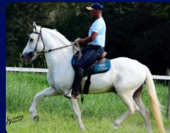
SEU PAI QUATI MORRO GRANDE DA ZIZICA