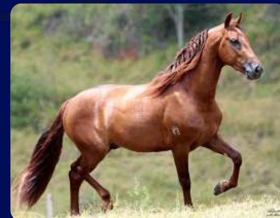
SEU PAI NEMO PORTEIRA AZUL