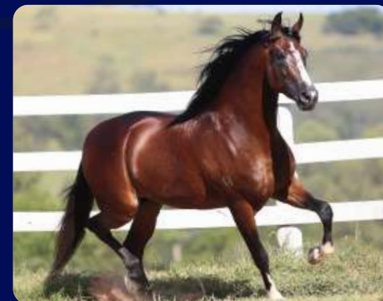
SEU PAI LÚCIDO DA FIGUEIRA