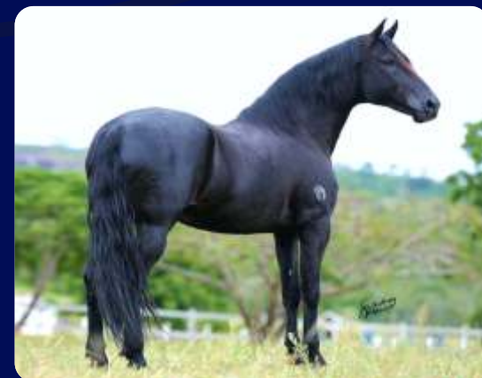
SEU PAI SUMARÉ VIAGRA