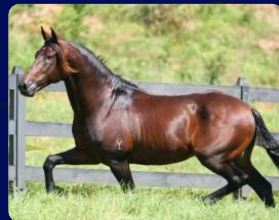
SEU AVÔ GRECO DO YURI

MACHO | REG: 48005 | NASC: 15/09/2014 | VENDEDOR: HARAS ILHA BELA