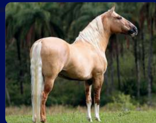
SEU PAI FATOR DA CAVARÚ-RETÃ