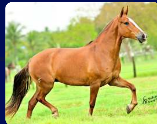
SUA MÃE FLAUTA I DA ANGLISA