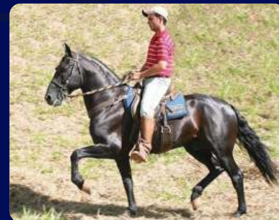
SEU PAI AMADO FESTIVAL

FÊMEA | REG: 283043 | NASC: 01/10/2016 | VENDEDOR: HARAS ILHA BELA RINGO D2 TRILHO DA ZIZICA RUBRA D2 AMADO FESTIVAL X FLAUTA I DE ANGLISA ZANGADA DE ANGLISA