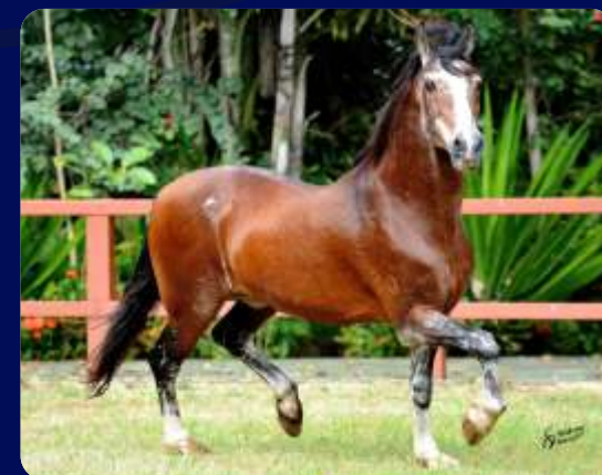
SEU AVÔ FAVACHO ÚNICO