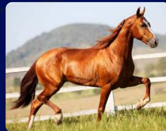
SEU PAI FARRAPO DN