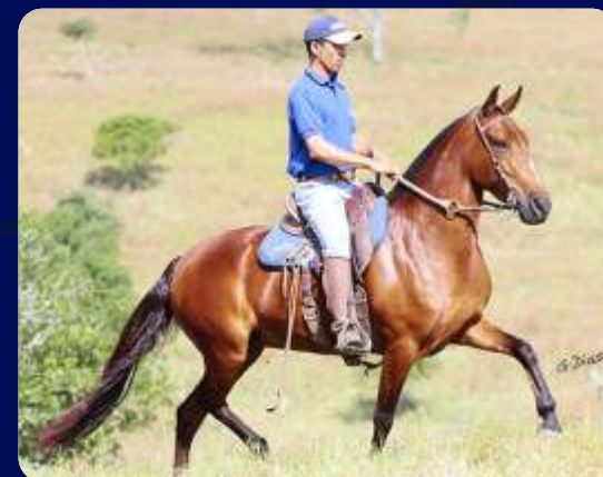
SUA MÃE YEMANJÁ PORTEIRA AZUL