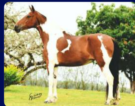
SUMA MÃE SUMARÉ XUXA

FÊMEA | REG: 177696 | NASC: 27/09/2016 | VENDEDOR: HARAS SUMARÉ KAMIKAZE E.A.O. | SUMARÉ VIAGRA X SUMARÉ XUXA | HAMLET DA CAVARÚ-RETÃ SUMARÉ ROLETA | SUMARÉ QUIMERA