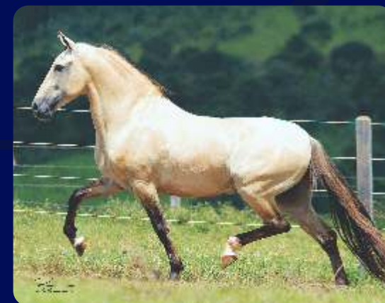
SEU AVÔ FAVACHO ESTANHO