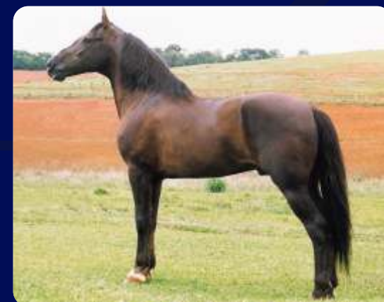
SEU AVÔ TRILHO DA ZIZICA

FÊMEA | REG: 167070 | NASC: 26/02/2016 | VENDEDOR: HARAS BANEG TRILHO DA ZIZICA GALANTE DO EXPOENTE X JORDÂNIA PORTEIRA AZUL ÚNICA KAFÉ HALTER DO CARDEAL IBÉRIA DO CARDEAL