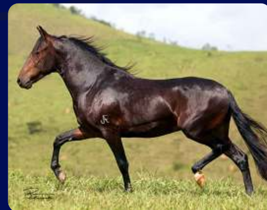
SEU PAI VERMUTE JEA