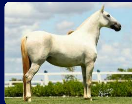
SUA MÃE NEVE PORTEIRA AZUL