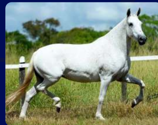
SUA MÃE NORMALISTA ELFAR

MACHO | REG: 54241 | NASC: 01/03/2017 | VENDEDOR: HARAS DN TRUC DO MORRO GRANDE FANTASIA DA RESTINGA QUATI MORRO GRANDE DA ZIZICA X NORMALISTA ELFAR MULATO D2 SINIRA DO BERMA