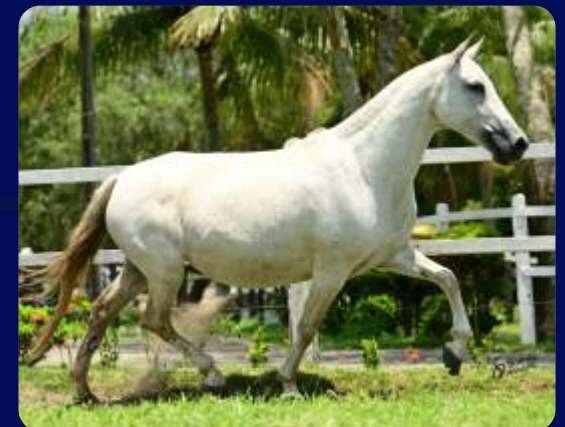
SUA MÃE JANGADA PORTEIRA AZUL

FÊMEA | REG: 306836 | NASC: 15/04/2018 | VENDEDOR: HARAS DN PAVÃO DO MORRO QUEIMADO BRAÚNA DE ALCATÉIA