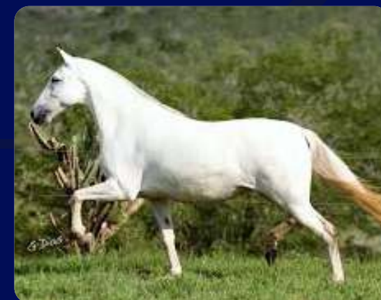
SUA MÃE FRAGATA PORTEIRA AZUL

CASTRADO | REG: 17389 | NASC: 12/05/2017 | VENDEDOR: HARAS PORTEIRA AZUL ESTANHO DE ALCATÁIA VERSAILLES DO LUMIAR OLARIA M.U.G. NEMO PORTEIRA AZUL X FRAGATA PORTEIRA AZUL SISTEMA VALE SUL