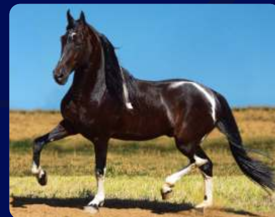
SEU AVÔ TORINO MARIMBÁ