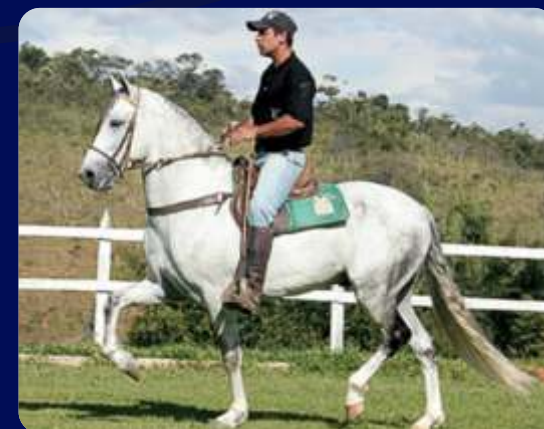
SEU PAI FARAÓ F.K.