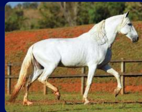
SEU PAI ABRIGO D2