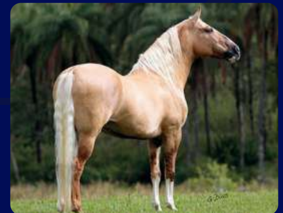
SEU PAI FATOR DA CAVARÚ-RETÃ

MACHO | REG: 30705 | NASC: 18/08/2010 | VENDEDOR: HARAS BANEG