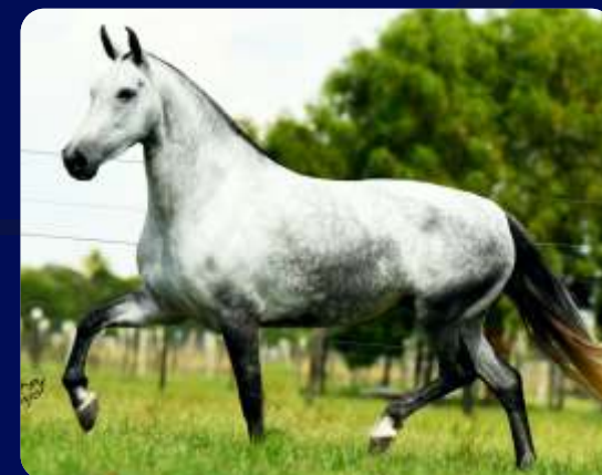
SUA MÃE ONÇA NEGRA DN