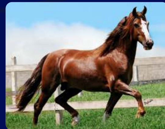
SEU PAI GALANTE DO EXPOENTE