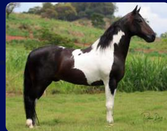
SEU AVÔ XPTO L.J.

FÊMEA | REG: 292104 | NASC: 08/11/2016 | VENDEDOR: HARAS ILHA BELA