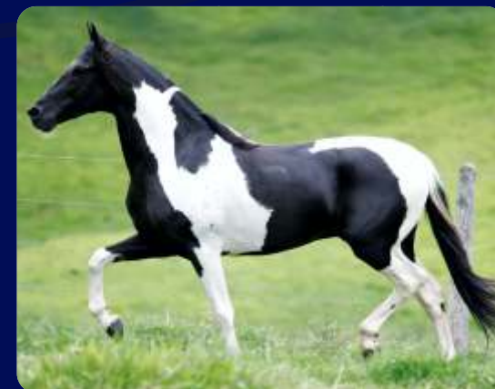
SEU PAI TALISMÃ KAFÉ

TÍTULO DA CALCIOLÂNDIA RIBALTA DA CALCIOLÂNDIA