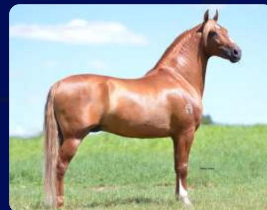
SEU AVÔ ESTANHO DE ALCATÉIA