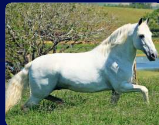
SEU AVÔ RINGO D2