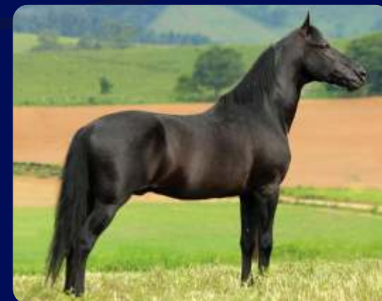
SEU PAI HAITY CAXAMBUENSE