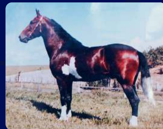
SEU BISAVÔ PALHAÇO DE ITUVERAVA