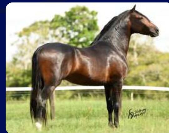
SEU PAI PATRIARCA DN

QUATI MORRO GRANDE DA ZIZICA MADRUGADA P.F.G.