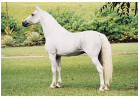
Seu avô materno, Marel Pitanga

Doadora de embriões de andamento clássico marchado, égua muito expressiva e raçuda, mãe comprovada e com grande habilidade reprodutiva. Filha de Indiscreto HZ em Querela do Guega, égua que leva em suas veias as origens do emérito reprodutor Marel Pitanga.