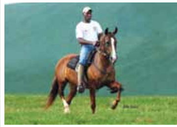
06. Vitrine da Santa Esmeralda