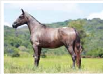
27. Lavinia da Figueira