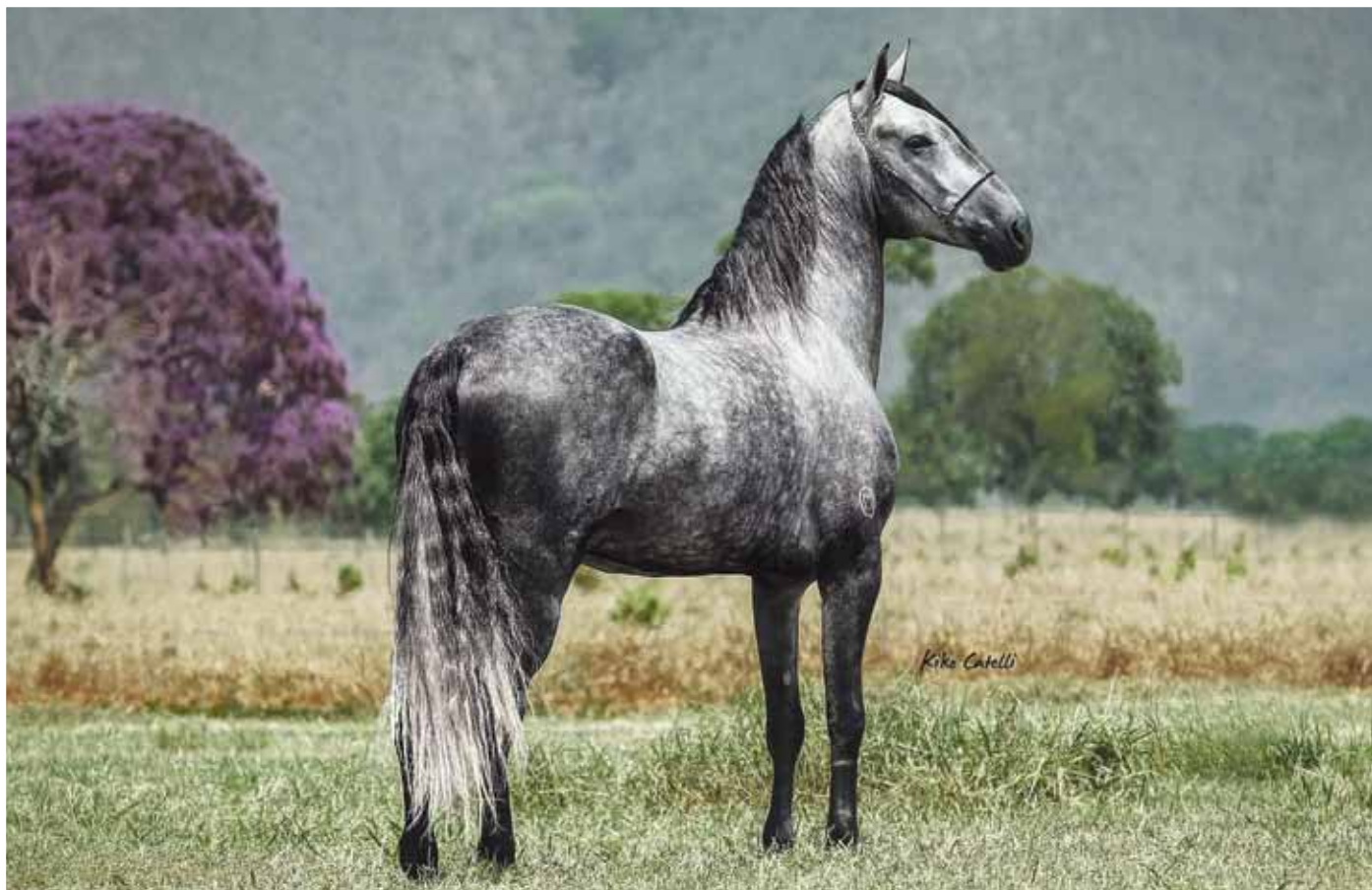
Seu pai, Favacho Diamante