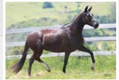
04. Lenda do Minatto