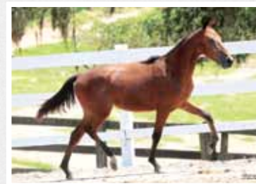
29. Mágica da Figueira