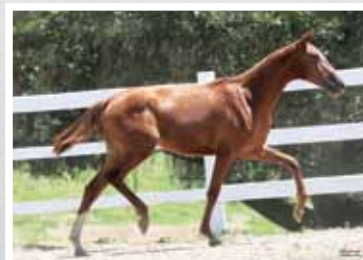
37. Moldura da Figueira