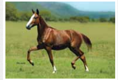
09. Alegria Lua de Prata