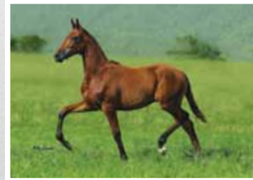
18. Boneca Lua de Prata 50%