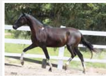
28. Listrada da Figueira 50%