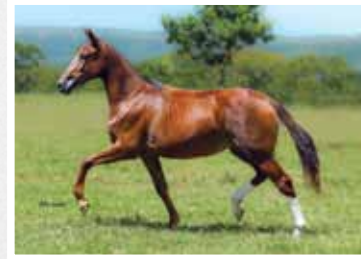
08. Açucena Lua de Prata