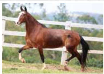
25. Jazida do Cardeal 50%