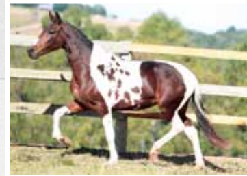
03. Esmeralda da Figueira