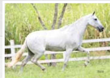
23. Itaqui Ópera