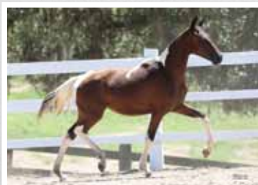
36. Moeda da Figueira 50%