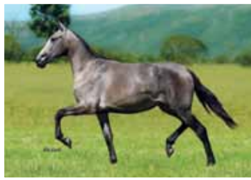
10. Aurora Lua de Prata