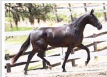
38. Natureza Porteira Azul 50%