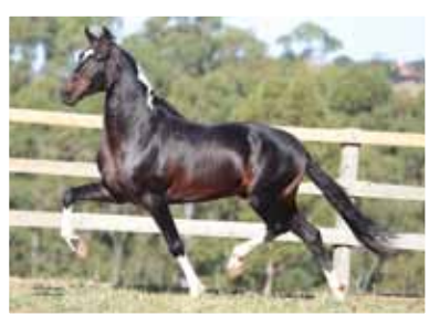
Seu pai, Iguaçu do Expoente

• Macho • 30/01/2015 • Vendedor: Haras Figueira