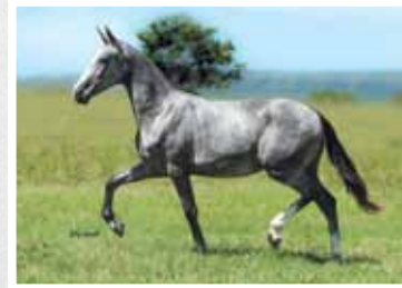
13. Alvorada Lua de Prata 50%