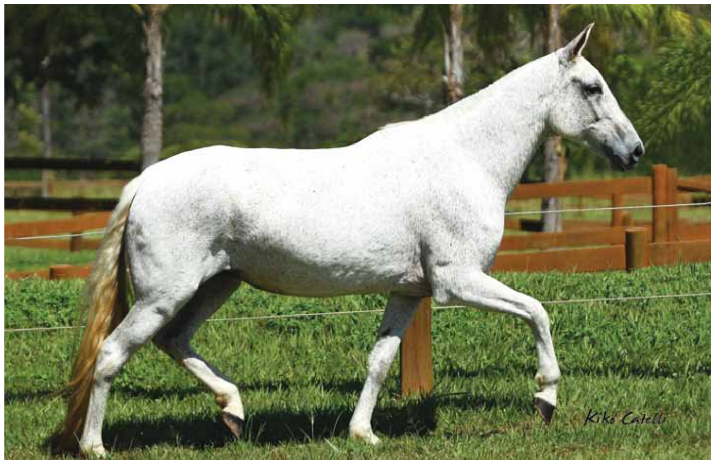
Seu filho, Mascate da Terra Vermelha