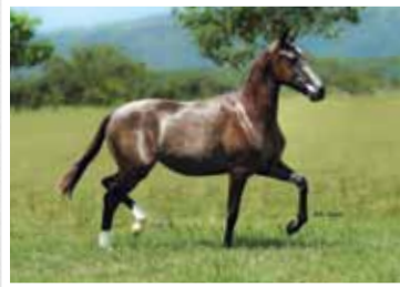
11. Aliada Lua de Prata 50%