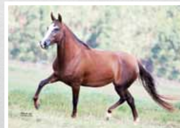
39. Norremose Fanfarra