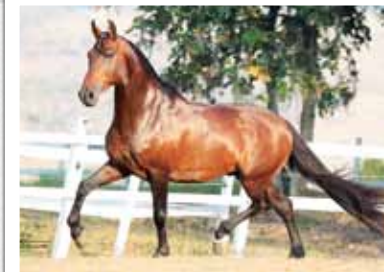
Sua mãe, Lua Negra MUG