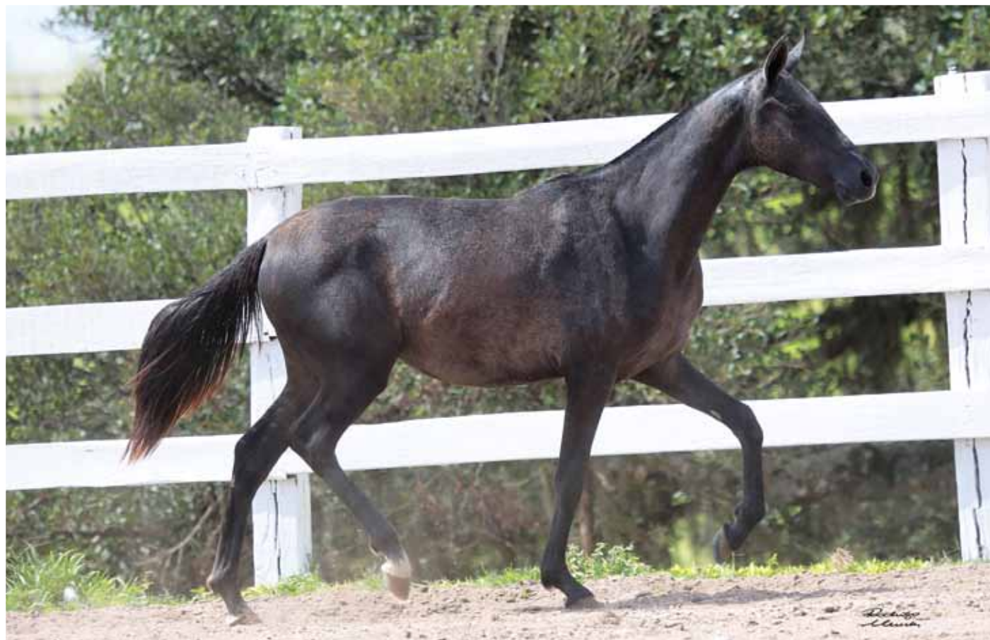
Sua mãe, Irada Morro Grande da Zizica