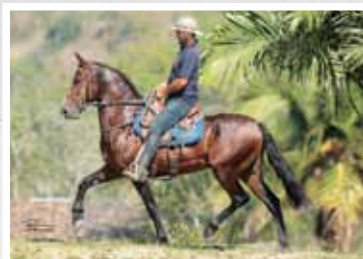
21. Iguaçu da Figueira