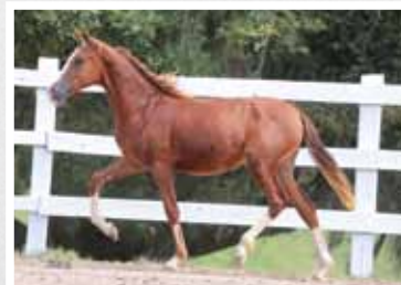
32. Marchador da Figueira