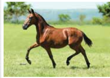
12. Aliado Lua de Prata