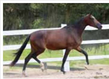
26. Laika da Figueira 50% ou 100%