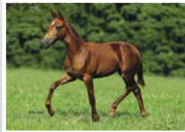
17. Babi Lua de Prata