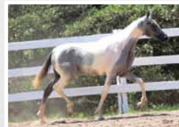
34. Masseratti da Figueira