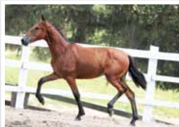
31. Malandro da Figueira 50%