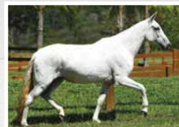
24. Java do Triângulo Jota