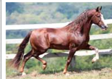
Avô do embrião, Truk Recanto Alegre