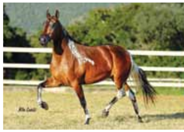
05. Marquezine Lua de Prata