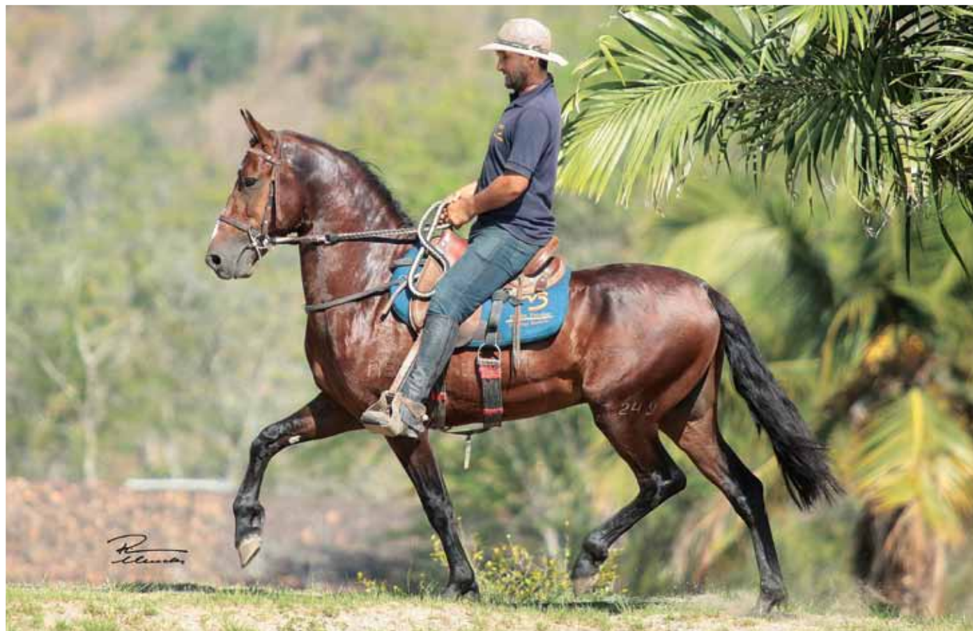
Seu pai, Galante do Expoente