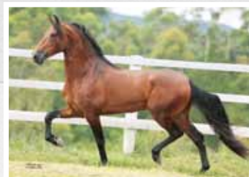
22. Intruso da Figueira