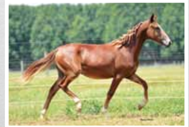
19. Colorado da Morada Nova