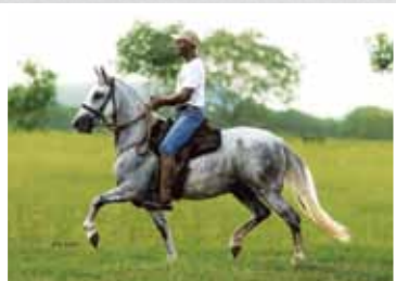
20. Feitiço da Figueira