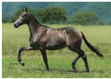
15. Aruanã Lua de Prata