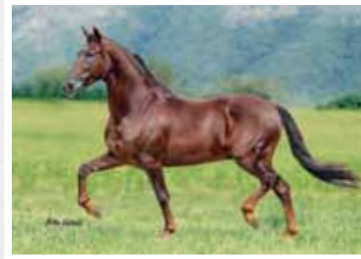
07. Acalá da Lua Prata