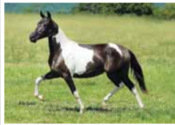
16. Atrévida Lua de Prata