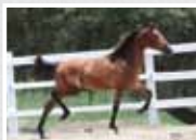
30A. Mago da Figueira