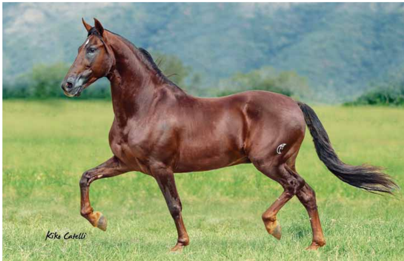
Seu pai, Acalá da Selva Morena