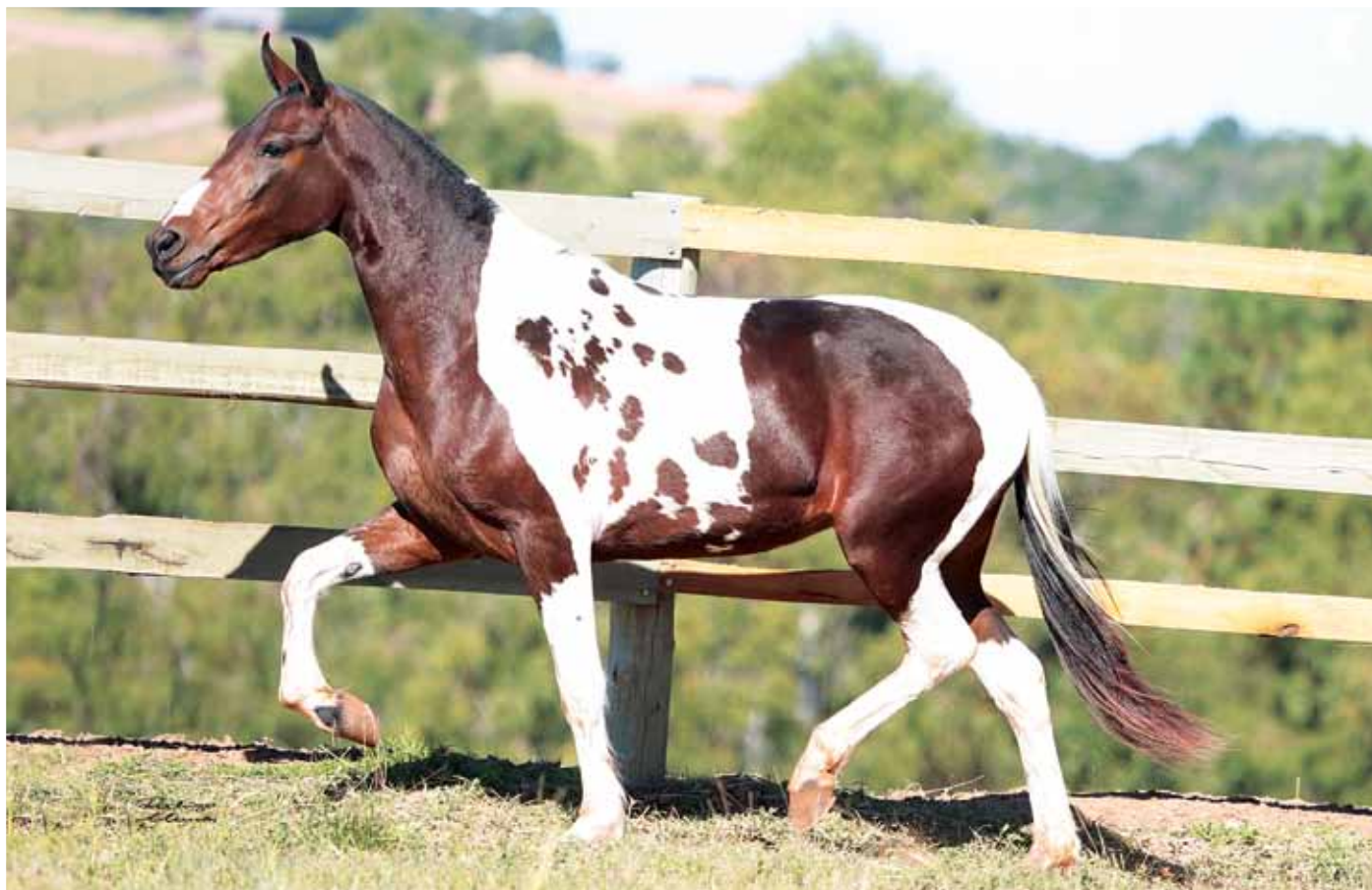
Embrião por Galante do Expoente