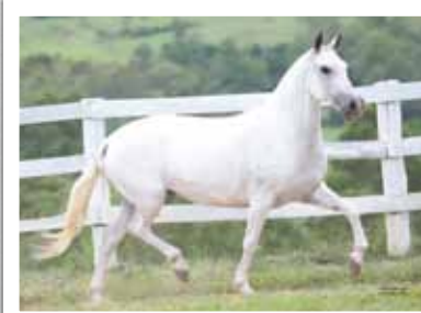
Sua mãe, Favacho Ola

• Macho • 27/12/2014 • Vendedor: Haras Figueira