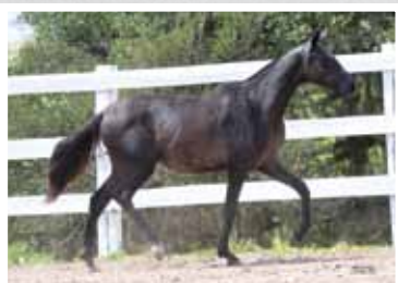
35. Menina da Figueira