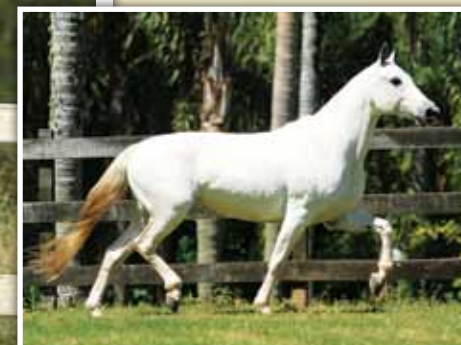
Sua mãe, Volúpia 7 Quadros