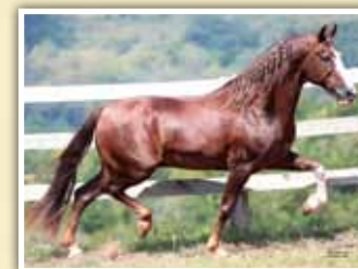
Seu pai, Galante do Expoente

• Macho • 10/09/2015 • Vendedor: Haras EMP