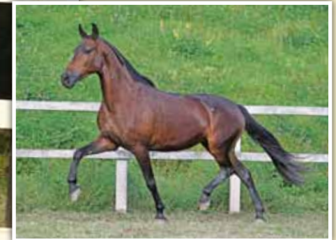
Sua mãe, Magazine Notícia