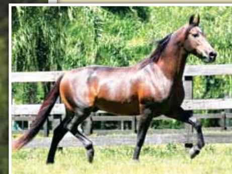
Seu pai, Cabuçu da Selva Morena