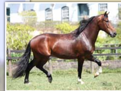
Seu pai, Lótus da Catimba