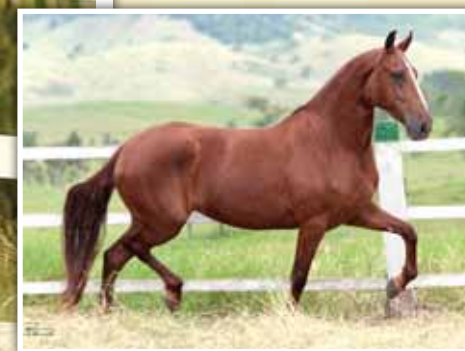
Sua mãe, Cereja do Rebanho