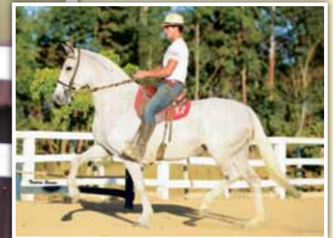
Sua mãe, Toada da Selva Morena