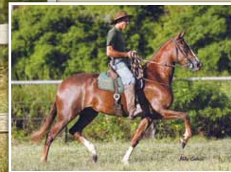
Sua mãe, Xitara Mocoquense