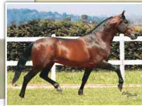
Seu pai, Beijo JB