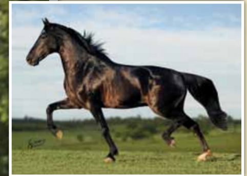
Seu pai, Elfo do Porto Azul