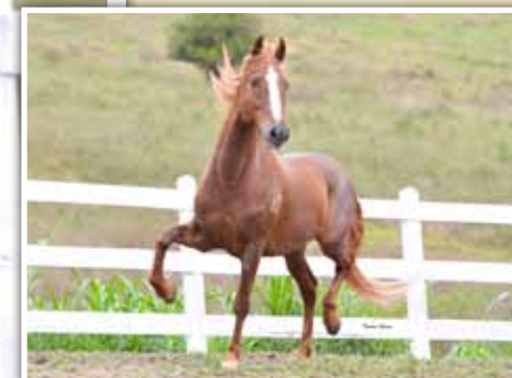
Seu pai, Palhaço da Santa Esmeralda