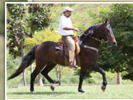
Seu pai, Plutão da Santa Helena