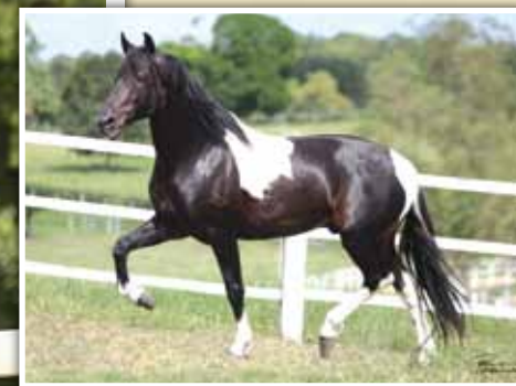
Seu pai, Extrato do Minatto