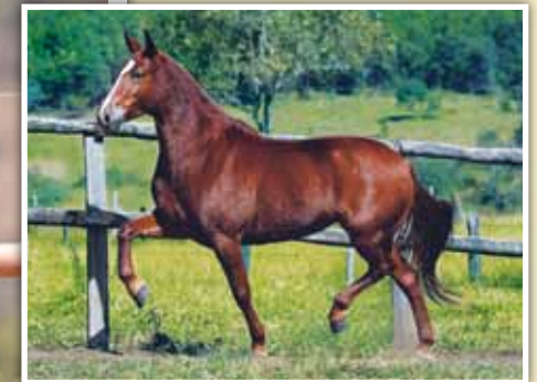
Sua mãe, Flauta do Rebanho