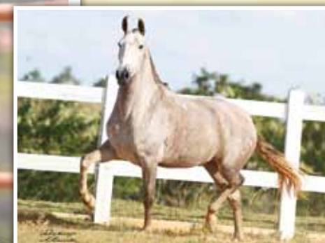
Sua mãe, Fascinação MFC