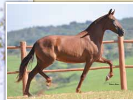
Sua filha, Epopéia EMP por Herdeiro da Ilha

Um das jóias deste leilão! Égua de pelagem castanha, muito bem caracterizada, feminina e de grande qualidade de andamento. Égua inscrita no TAC, mas com um grande currículo em pistas. Vai com potra filha do Farrapo DN