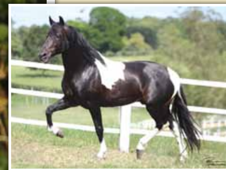
Seu pai, Extrato do Minatto