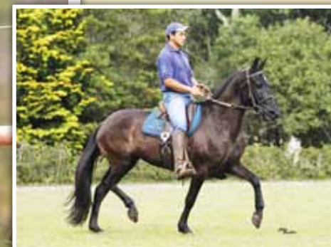
Sua mãe, Noviça M.U.G.