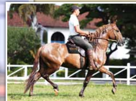
Seu pai, Desafio de Alcatéia