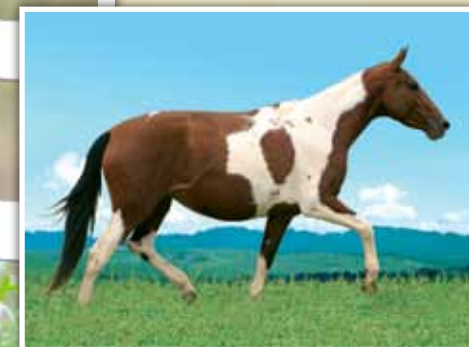
Sua mãe, Orquídea JB