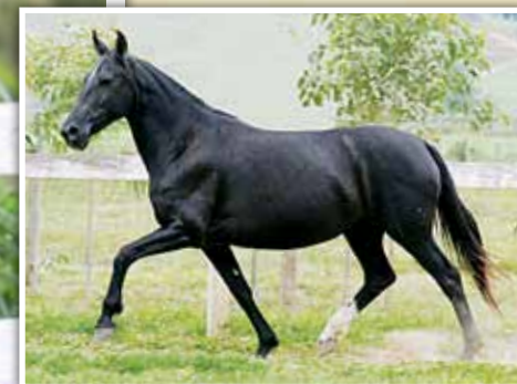
Sua mãe, Época JB