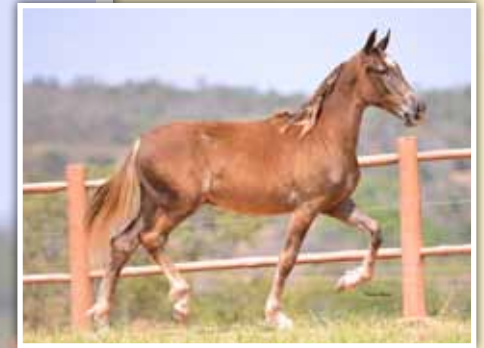
Seu irmão paterno, Guardiola EMP