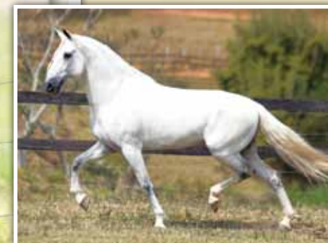
Embrião por Abrigo D2