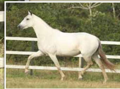
Sua mãe, Sonata do Porto Palmeira