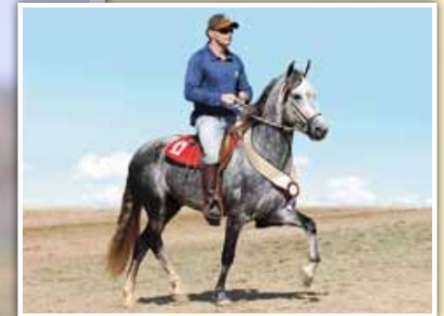
Seu pai, Faraó FK