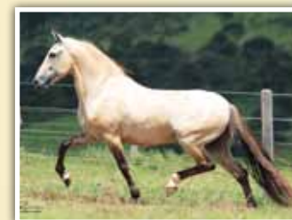
Seu avô, Favacho Estanho

• Macho • 21/09/2015 • Vendedor: Haras EMP