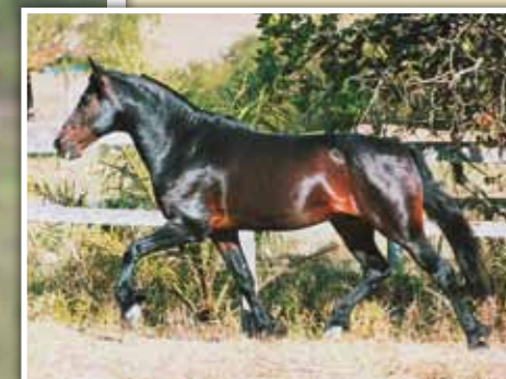
Seu avô paterno, Mulato D2

Égua de pelagem tordilha, marchadeira, expressiva e caracterizada. Filha do reprodutor, Sino D2, portanto, neta de Mulato D2, em Santo Antônio Festejada.