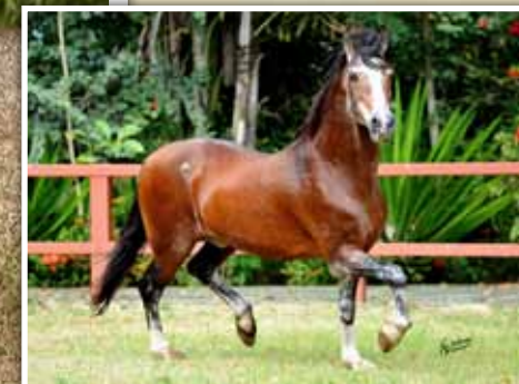
Avô do embrião, Favacho Único