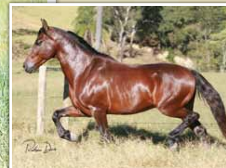
Avô do embrião, Cravo AF

Embrião gestado da championíssima doadora, Itaúna Pontal com o extraordinário reprodutor, Ringo D2. Embrião que leva o sangue de importantes nomes da nossa raça, como Mulato D2 e Capricho D2.