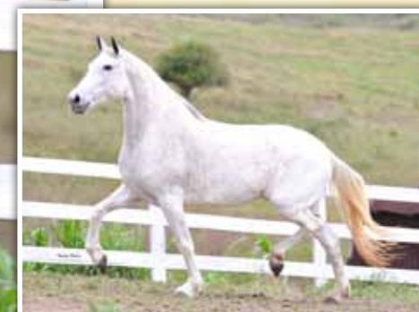
Sua mãe, Petúnia do Yuri