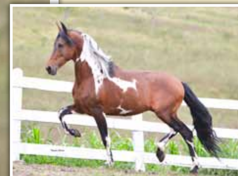
Prenhez por Vermute JB