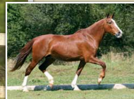
Sua mãe, Eletra de Guarantã