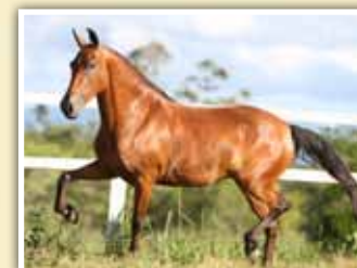
Seu mãe, Urca CF da Sercore