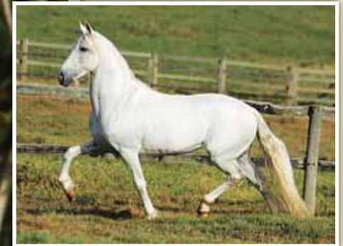
Seu pai, Angai Turbante