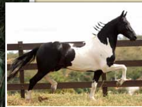
Seu pai, Carvão L.J.N.D.