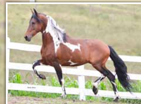
Prenhez por Vermute JB