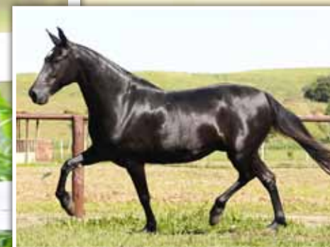
Sua mãe, Bonança D2