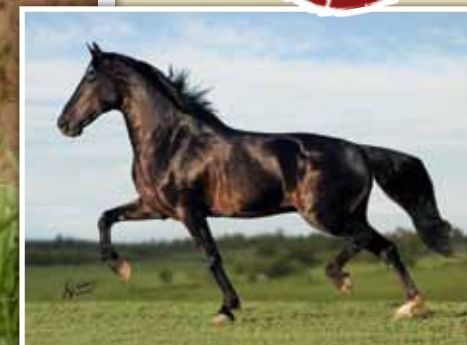
Embrião por Elfo do Porto Azul