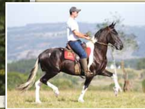
Seu pai, Triunfo do Porto Palmeira