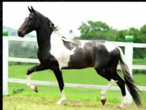
PREENHA DO QUARK E.A.O.