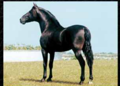
SEU PAI LAMPEÃO HO

FILHO DO LAMPEÃO HO, GARANHÃO QUE FEZ HISTÓRIA NO MANGALARGA MARCHADOR, O RUIÍDO E.A.O. CHEGA PARA ABRILHANTAR AINDA MAIS ESSE LEILÃO EM QUE A QUALIDADE ESTÁ PRESENTE NO NOME. TRAZ ESSA GENÉTICA QUE É DIFERENCIADA, ALÉM DE APRESENTAR ESSE ANDAMENTO ESPETACULAR, É UM VERDADEIRO GARANHÃO. COM CERTEZA IRÁ SOMAR EM QUALQUER CRIATÓRIO DO BRASIL.