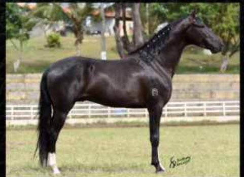
SEU PAI TRIBUNAL H.D.

ÉGUA DOS MEUS SONHOS, NEGRA COMO SEU PAI E AVÔ, ESSA ÉGUA É NETA DO KADAR E.A.O. E DA FANTAZIA H.D., AMBOS INSCRITOS NO LIVRO DE ELITE – MM7. ALÉM DISSO, AINDA SE ENCONTRA EM INÍCIO DE DOMA E JÁ APRESENTA A VERDADEIRA MARCHA PICADA.