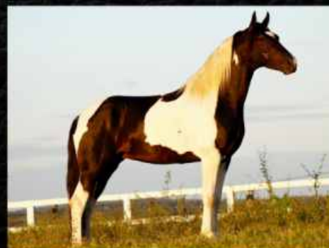
SEU PAI FESTIVAL DITON

PRONTA PARA SERVIR AOS MAIS EXIGENTES CRIATÓRIOS DE MARCHA PICADA.