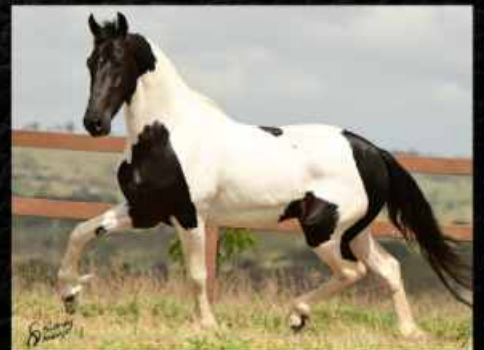
PRENHA DO MAJOR DO ALTO ALEGRE

ESSA BELÍSSIMA ÉGUA REÚNE TUDO O QUE SE ESPERA DE UMA GRANDE DOADORA: PERFEITO PADRÃO RACIAL, BEM ESTRUTURADA, MARCHA PICADA GENUÍNA, PRODUTOS DESTACADOS COM DIVERSOS GARANHÕES E PREMIAÇÕES DE PISTA. FOI CAMPEÃ OU RESERVADA EM TODAS AS PROVAS QUE COMPETIU. REALMENTE, UM DESTAQUE DESTE LEILÃO. VAI PRENHA DO GARANHÃO PAMPA DE PRETO, MAJOR DO ALTO ALEGRE, UM FILHO DO CAMPEÃO NACIONAL, QUARTEL DO DANTE.