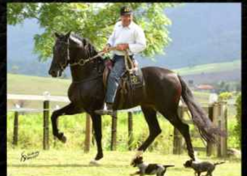
SEU PAI KADAR E.A.O.

HARMONIA DO PINA É UMA FILHA DO GRANDE KADAR E.A.O., 2º NO RANKING DE PICADO 2017, DISPENSA COMENTÁRIOS, NA NUANCE DO PINA, PRINCIPAL DOADORA DE EMBRIÕES DO HARAS DO PINA, ÉGUA QUE MORREU MUITO CEDO, MAS QUE VEM MOSTRANDO A FORÇA DE SUA GENÉTICA EM VÁRIOS CAMPEONATOS, ATRAVÉS DE ALGUNS DE SEUS FILHOS, COMO, ARAKETO DO PINA (GARANHÃO CHEFE DO HARAS), DRAGÃO DO PINA E XARLATÃO HD. SUA AVÓ É UMA FILHA DIRETA DO GRANDE FANTOCHE DA PRIMAVERA, UMA RARIDADE GENÉTICA HOJE EM DIA. A HARMONIA SAGROU-SE CAMPEÃ DE MARCHA RECENTEMENTE, NA SUA PRIMEIRA PISTA, EM LAGARTO/SE.