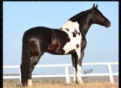
PREENHA DO GAIATO DO BERRO D'ÁGUA

VAI COM PREENHEZ POSITIVA DO REPRODUTOR GAIATO DO BERRO D'ÁGUA, PAMPA DE PRETO, HOMOZIGOTO E DE MARCHA PICADA. PREVISÃO DE PARTO PARA 20/06/2018.