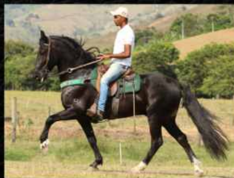
SEU PAI BENTO DO CEL

POTRA CASTANHA DE TRÊS ANOS, RECÉM INICIADA NA DOMA E QUE JÁ MOSTRA MUITA QUALIDADE DE MARCHA PICADA; ESSA É PISTA E DAS BOAS; NETA POR PARTE DA MÃE DO GRANDE CAMPEÃO NACIONAL ZORRO LJ E POR PARTE DO PAI DE, NADA MAIS NADA MENOS, QUE, O ELFO DO PORTO AZUL; PORTANTO GENÉTICA TOP E INDIVÍDUO MAGNÍFICO; PARA QUEM QUER UMA POTRA DE PISTA, TÁ AÍ A OPORTUNIDADE.