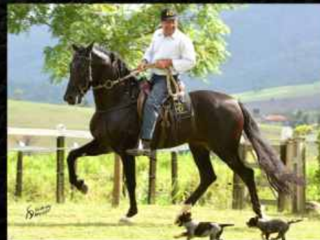
EMBRIÃO POR KADAR E.A.O.

DITADORA CONQUISTOU OS TÍTULOS DE CAMPEÃ NACIONAL ÉGUA SÊNIOR - MARCHA PICADA 2017; CAMPEÃ NACIONAL ÉGUA MAIOR - MARCHA PICADA 2016 E RESERVADA CAMPEÃ ÉGUA MAIOR DE MARCHA PICADA 2016.