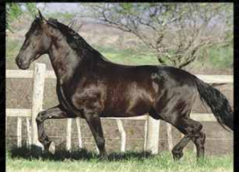
SEU PAI EL CID DO PORTO AZUL

UMA LINDA FILHA DO EL CID DO PORTO AZUL E NETA DE HERDADE FAISÃO. ACOMPANHA POTRO PRETO, NETO DE LAMPEÃO HO, FILHO DE NEGRITO DE MAIRI, NASCIDO EM 29/08/2017.