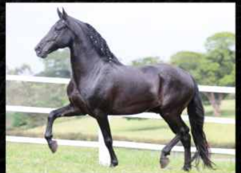
PRENHA DO FÉ E.A.O.

FILHA DE ELFO DO PORTO AZUL COM A EMBARCAÇÃO DO PORTO AZUL, LOGO, NETA DO GRANDE HAITY CAXAMBUENSE, SANGUE PROVADO NA MARCHA. SEGUE COM PREENHEZ POSITIVA DO GARANHÃO CAMPEÃO NACIONAL FÉ E.A.O., COM PREVISÃO DE PARTO PARA FEVEREIRO DE 2018.