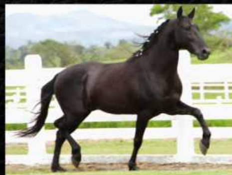
SEU PAI GUERREIRO KAFÉ DA NOVA

SEM DÚVIDAS UM DOS GRANDES LOTES DESTE LEILÃO!