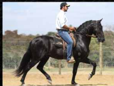
SEU PAI QUARTEL DO DANTE

ESSE É UM GRANDE EXEMPLAR PARA OS APAIXONADOS PELA PELAGEM PAMPA. MAJOR DO ALTO ALEGRE É FILHO DO CAMPEÃO NACIONAL DE MARCHA PICADA, QUARTEL DO DANTE E SE DESTACA PELA BELEZA E EXPRESSÃO RACIAL.