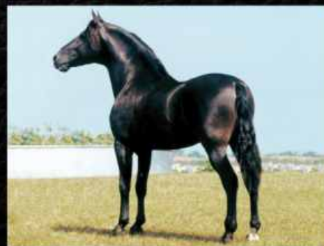
SEU PAI LAMPEÃO HO

O HARAS MARIQUITA COLOCA A DISPOSIÇÃO ESSA ÉGUA JOVEM, FILHA DE UM DOS MAIORES GARANHÕES DO BRASIL, O SAUDOSO LAMPIÃO HO. CASCATA É PREMIADA EM PISTAS, DE UMA PELAGEM EXCEPCIONAL (PRETA), MORFOLOGIA INVEJÁVEL, EXCELENTE ANDAMENTO, COMODIDADE EXCEPCIONAL E, AINDA POR CIMA, VAI COM PREENHEZ DE 5 MESES DO GRANDE GARANHÃO OBAMA DA RIOCON, UM IRMÃO PRÓPRIO DO GRANDE JUBILEU DA PIPOCA.