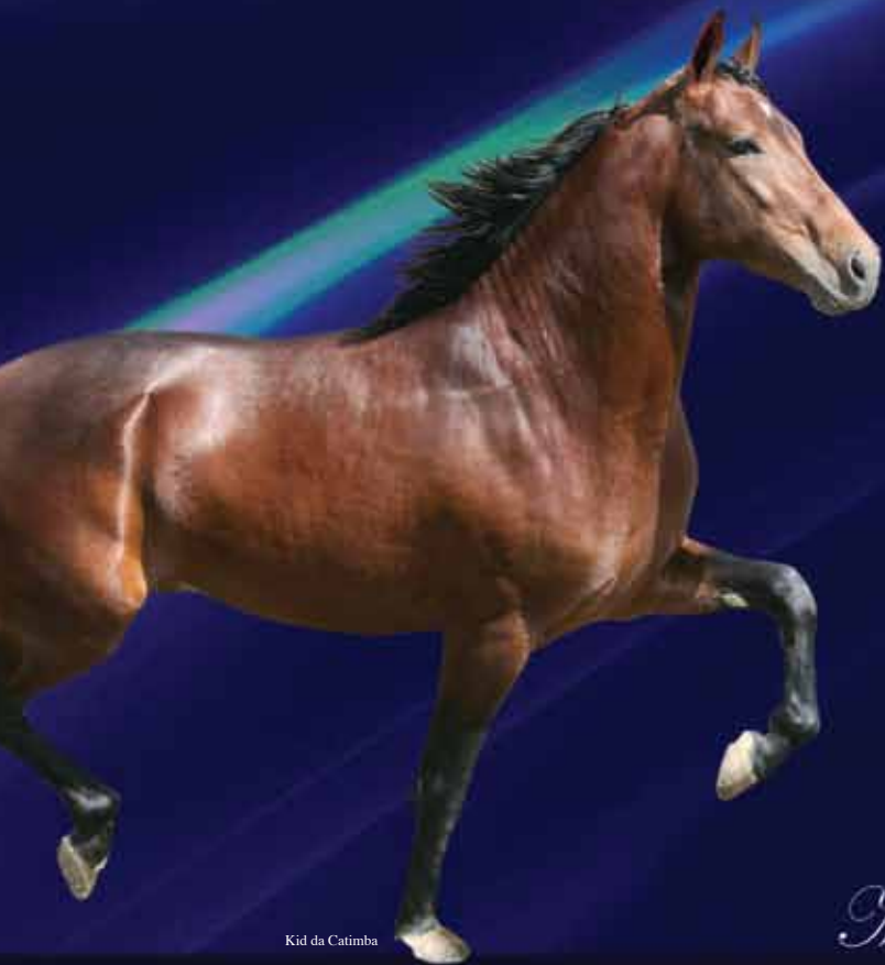
Kid da Catimba