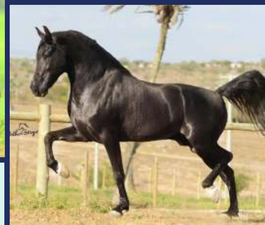
EMBRIÃO POR MUSSUM DA RIOCON