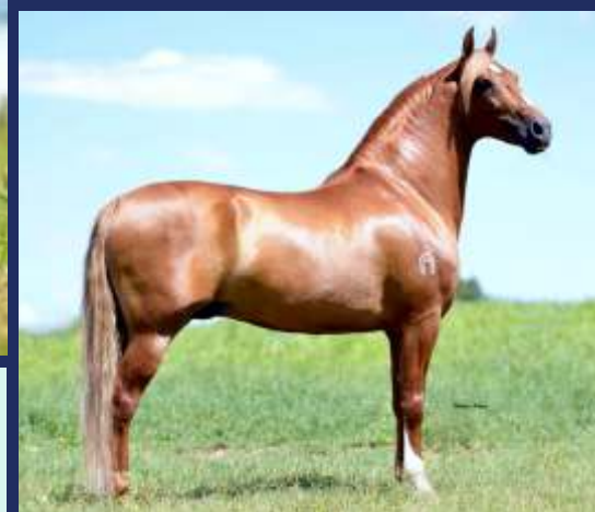
SEU PAI ESTANHO DE ALCATÉIA

FÊMEA • REG: 0176884 • NASC: 04/10/2016 • VENDEDOR: HARAS PADRÃO PAVÃO DO MORRO QUEIMADO ESTANHO DE ALCATÉIA X NORMALISTA ELFAR BRAÚNA DE ALCATÉIA MULATO D2 SINIRA DO BERMA