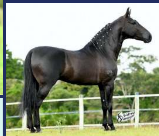
PRENHA DO TIMONEIRO DA RIOCON

FÊMEA • REG: 0161326 • NASC: 20/08/2014 • VENDEDOR: HARAS VB