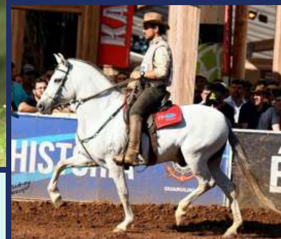
EMBRIÃO POR ELDORADO DA BOA TERRA