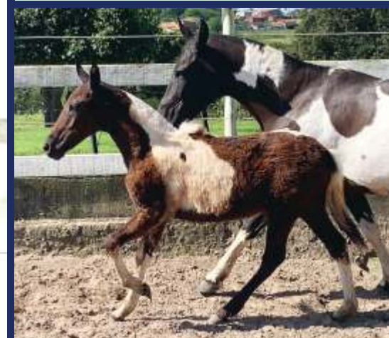
GRAN RESERVA VB (GAYA CAPIM FINO X ELFO DO PORTO AZUL)