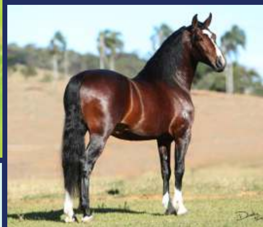
SEU PAI ÚNICO DE SÃO LOURENÇO

COM MUITO DESPRENDIMENTO O HARAS ENGENHO DO POÇO DISPONIBILIZA AOS AMIGOS, UMA DAS MELHORES POTRAS NASCIDAS NA ÚLTIMA ESTAÇÃO, UMA FILHA DO REPRODUTOR ÚNICO DE SÃO LOURENÇO NA NIGÉRIA DE ALCATÉIA.