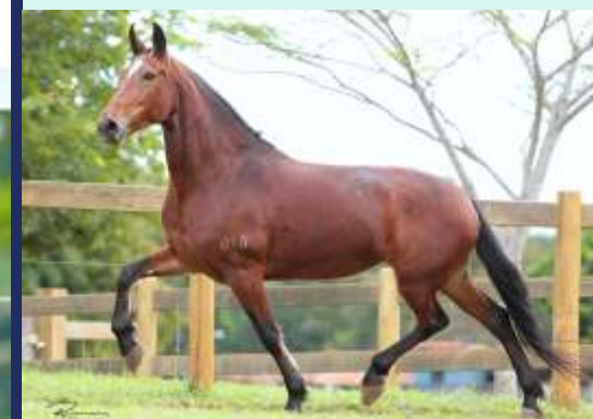
SINFONIA DA SANTA ESMERALDA