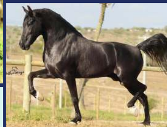
EMBRIÃO POR MUSSUM DA RIOCON