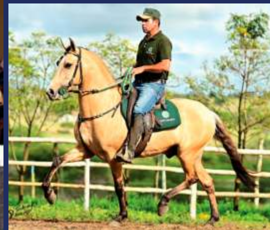
SEU FILHO RELEVO CARAÍBAS

SIMPLESMENTE O TRI CAMPEÃO NACIONAL DE MARCHA (2016, 2017 E 2018) E CAMPEÃO DOS CAMPEÕES NACIONAL DE MARCHA 2018.