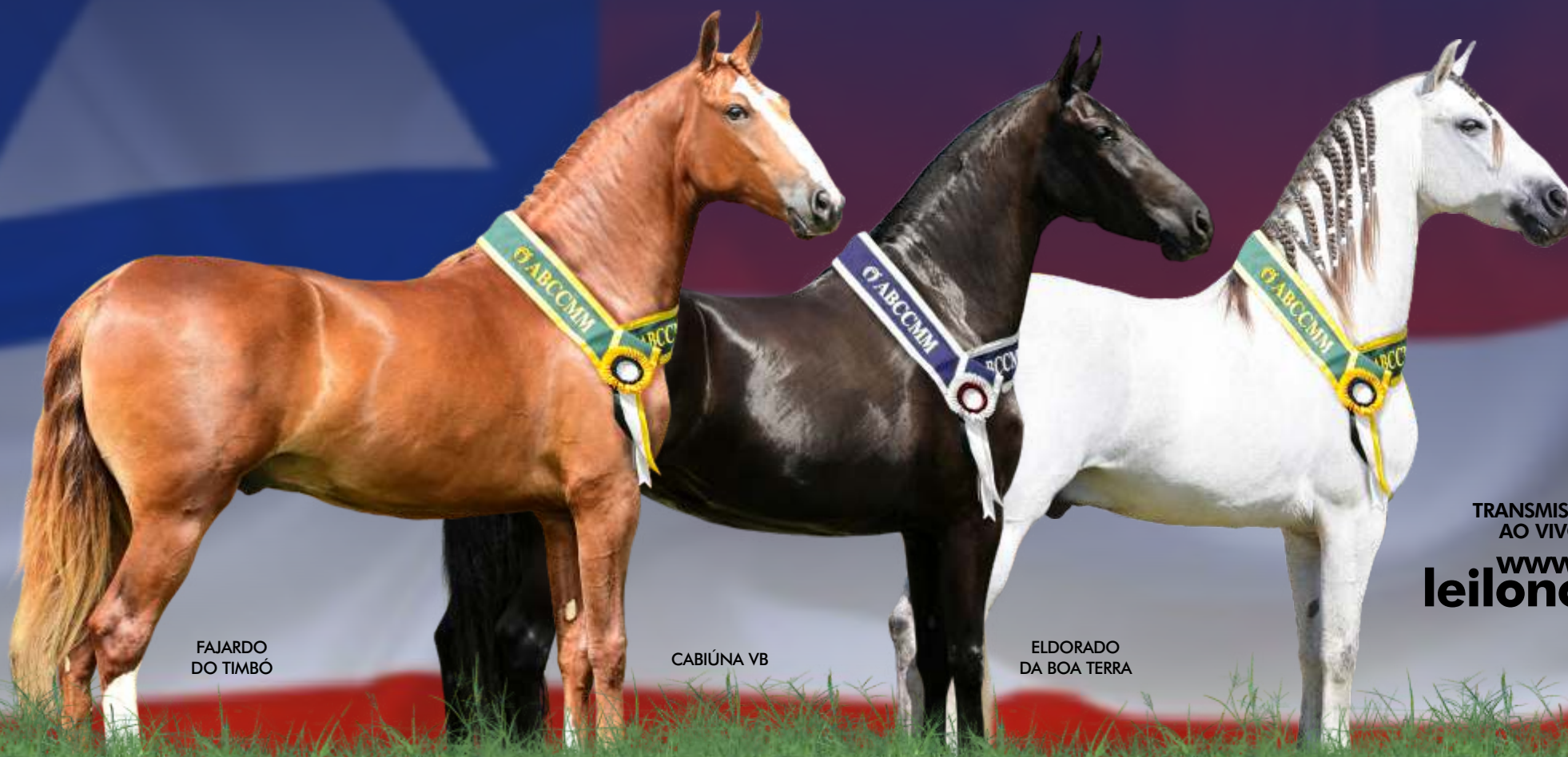
FAJARDO DO TIMBÓ