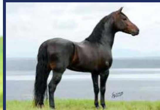
PRENHA DO ÁRTICO DO CONFORTO

SEGUE PRENHA DO GARANHÃO DE MARCHA PICADA CAMPENSÍSSIMO EM PISTA, ÁRTICO DO CONFORTO, UM FILHO DO TRILHO DA ZIZICA.