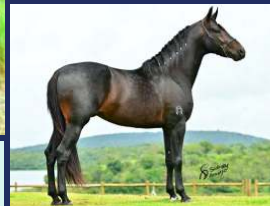
EMBRIÃO POR CAFÉ SUL MINEIRO