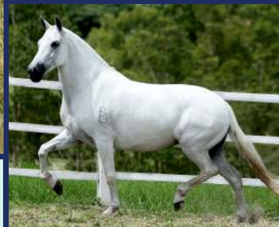
SUA MÃE SINIRA DO BERMA