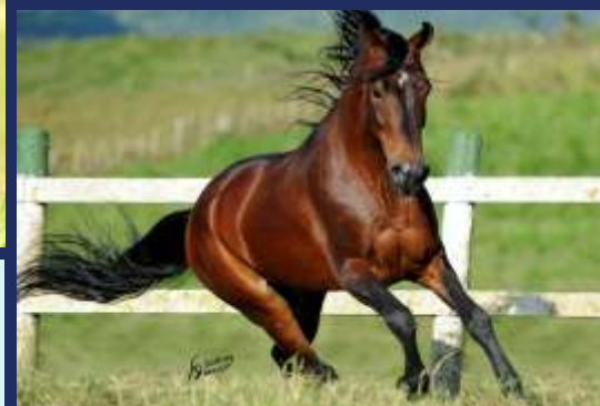
PARIDA DE MACHO DO HERDADE ROLEX

FÊMEA • REG: 0167082 • NASC: 05/11/2014 • VENDEDOR: HARAS ENGENHO DO POÇO