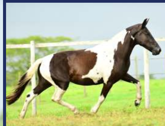
FADA DA MOLDURA