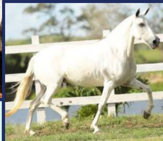
SUA IRMÃ COLÔMBIA DO QUOCIENTE

VENDEDOR: CONDOMÍNIO ELDORADO DA BOA TERRA