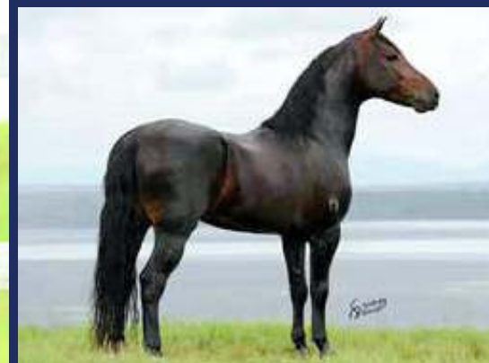
PRENHA DO ÁRTICO DO CONFORTO

LINDA POTRA CASTANHA MUITO BOA DE MARCHA, ELA QUE É UMA FILHA DO HERDADE ROLEX NA TURQUIA DA GAROA, ESSA É IRMÃ DE MÃE DA CANTIGA I DA GAROA, ÉGUA DE MARCHA PICADA JÁ PREMIADA EM PISTA. APESAR DE AINDA JOVEM, SEGUE PRENHA DO GARANHÃO DE MARCHA PICADA CAMPENSÍSSIMO EM PISTA, ÁRTICO DO CONFORTO.