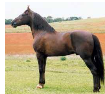
SEU AVÔ TRILHO DA ZIZICA

LINDA POTRA NEGRA, MUITO DIAGRAMADA, MARCHADA E COM MOVIMENTAÇÃO ESPETACULAR! FILHA DO CAXAMBU ALMANAQUE, QUE VAI AO RENOMADO GARANHÃO TRILHO DA ZIZICA. SANGUE DE CAMPEÕES! POTRA QUE PROMETE NAS PISTAS.