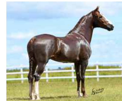
OU MUSSOLINI DA PEDRA VERDE