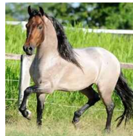
SEU PAI ITAPARICA LÍDER

POTRO DE EXCELENTE ANDAMENTO, EXPRESSIVO E COM MUITO FUTURO PELA FRENTE. FILHO DO CAMPEÃO NACIONAL, ITAPARICA LÍDER, RADAR TEM TUDO PARA SEGUIR A VITORIOSA CARREIRA DE SEU PAI.