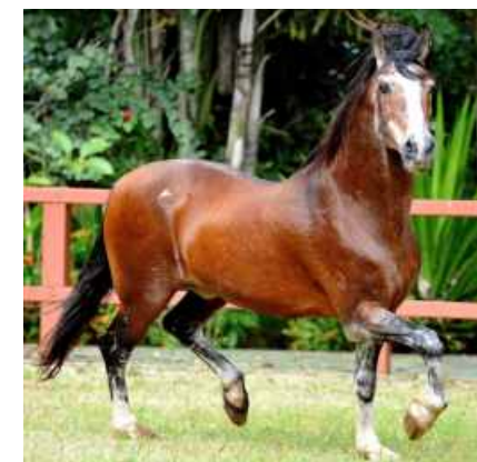
SEU PAI FAVACHO ÚNICO