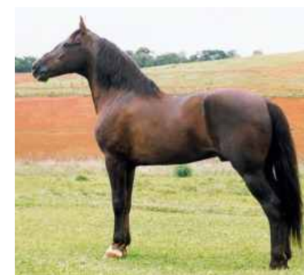
SEU AVÔ TRILHO DA ZIZICA

ZUMBA TRAZ GENÉTICA COMPROVADA, MARCADEIRA GENUÍNA, MORFOLOGIA SUPERIOR. UMA OPORTUNIDADE PARA FAZER PISTA E POTENCIAL ENORME PARA MARCHA PICADA NO CRUZAMENTO, COMO TAMBÉM PARA MARCHA CONVENCIONAL. ESSA NÃO TEM ERRO. TRILHO DA ZIZICA NA LINHA SUPERIOR E NA LINHA NA LINHA MATERNA TEM O RINGO D2, MULATO D2 E HAVANA D2.