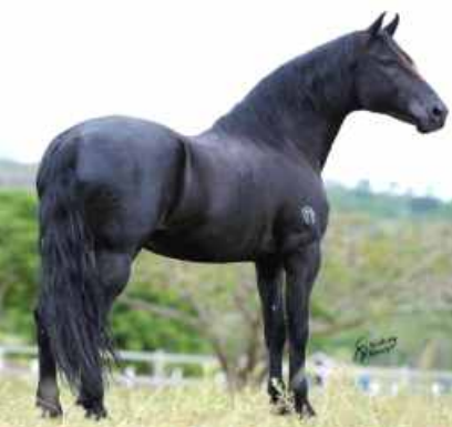
SEU PAI SUMARÉ VIAGRA

O HARAS SUMARÉ, EM DEFERÊNCIA AO LEILÃO TOP BAHIA, COLOCA À VENDA UMAS DAS MELHORES FILHAS DE SUMARÉ VIAGRA!!