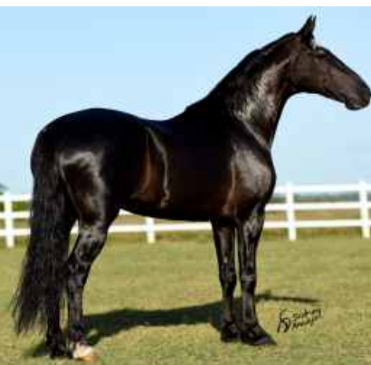
SEU PAI ELFO DO PORTO AZUL