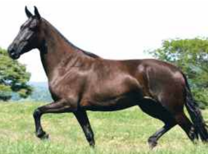
SUA AVÓ NEGRA DA SANTA ESMERALDA