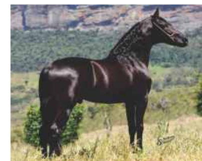
OU MUSSUM DA RIOCON