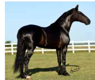
EMBRIÃO POR ELFO DO PORTO AZUL