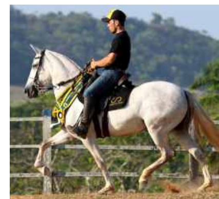
SUA FILHA FACEIRA CEDRO DA SERRA