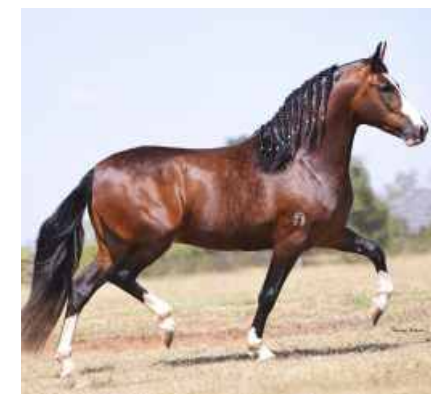
SEU PAI TEOREMA DA MORADA NOVA

TEOREMA DO YURI É UMA VERDADEIRA PINTURA! BELÍSSIMA PELAGEM ALAZÃ. FILHO DO CAMPEÃO E PRODUTOR DE CAMPEÕES, TEOREMA DA MORADA NOVA, QUE VAI AO GUARITÁ SEARA DOURADA E BEIJO JB. CAVALO COM MAIS DE 15 TÍTULOS EM PISTA, COM CERTEZA DARÁ MUITAS ALEGRIAS AO SEU NOVO PROPRIETÁRIO. RARIDADE!!!