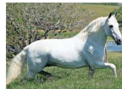
SEU BISAVÔ RINGO D2