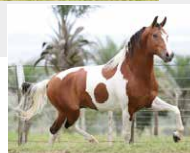
Prenhez por Kuluko da Pipoca