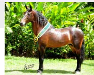
Seu pai Hércules da Evolução