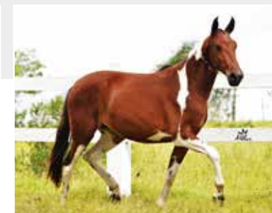
Genebra de Itapoan