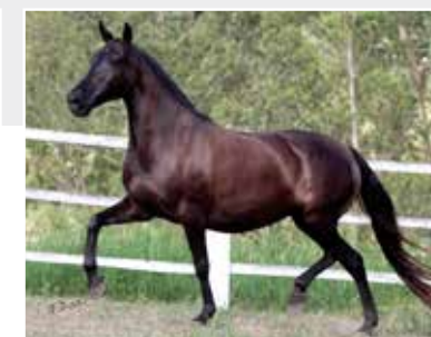
Sua mãe Revolta Kafé