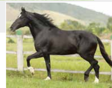
Seu pai Turista de Santa Lúcia

Fêmea Nasc.: 19/08/2009 Vendedor: Haras EAO