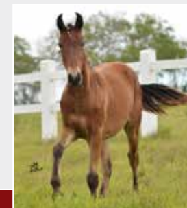
Namorado de Itapoan