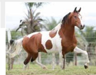
Seu pai Kuluko da Pipoca