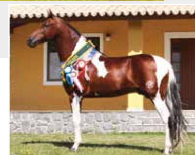
Seu pai Veludo Kafé