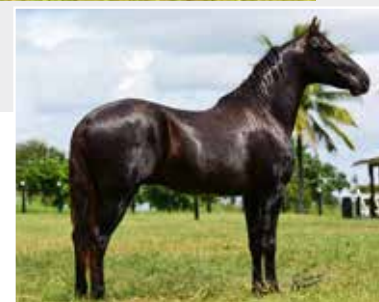
Seu pai Gato JFS