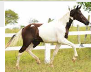
Napoleão de Itapoan