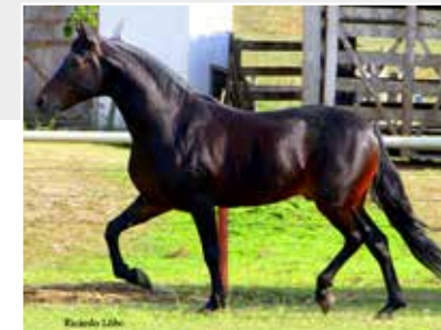
Seu pai Godar do Minatto

Fêmea Nasc.: 29/01/2014 Vendedor: Haras Bom Sossego