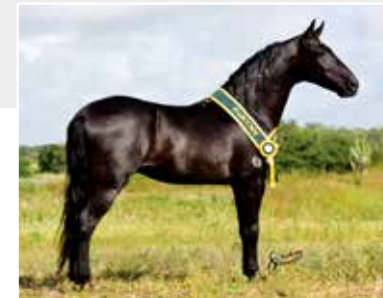
Seu pai Quartel do Dante