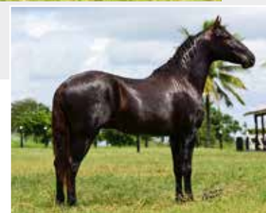
Seu pai Gato JFS