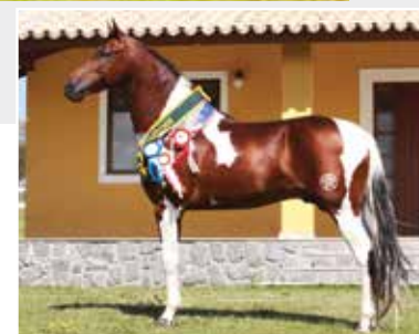
Seu pai Veludo Kafé