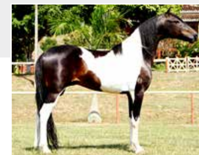
Seu pai Valete Kafé