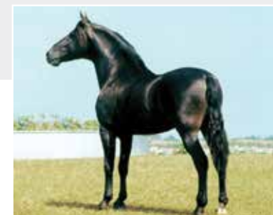
Seu avô Lampeão HO