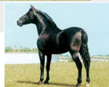
Seu avô Lampeão HO