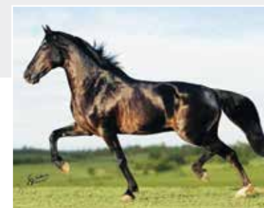
Seu avô Elfo do Porto Azul