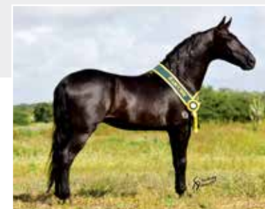
Seu pai Quartel do Dante