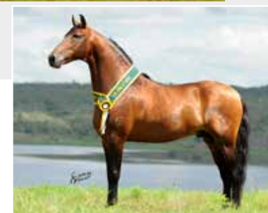
Prenhez por Nero de Itapoan