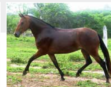
Sua mãe Namorada de Itapoan