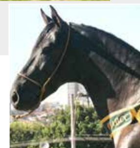
Seu pai Jongo da Pipoca