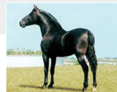
Seu avô Lampeão HO