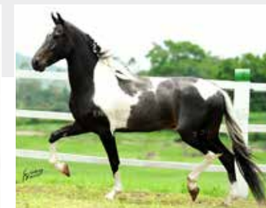
Prenhez por Quark E.A.O