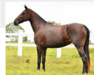
Dama de Itapoan