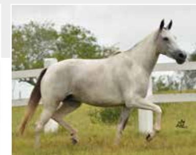
Imperatriz de Itapoan