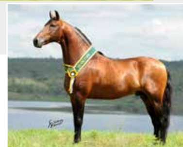
Seu pai Nero de Itapoan