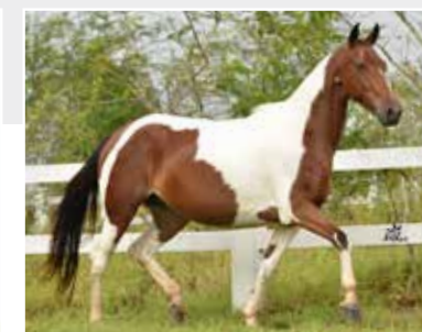
Baroneza de Itapoan