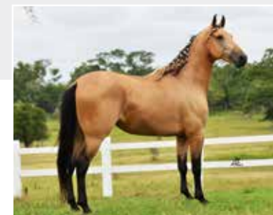
Astro de Itapoan