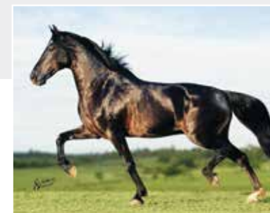
Seu avô Elfo do Porto Azul