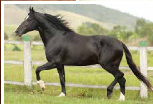
Seu pai Turista de Santa Lúcia