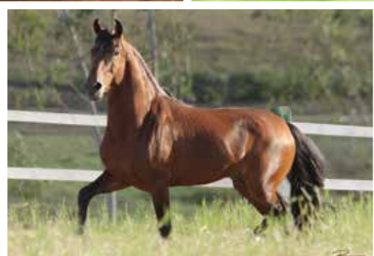
Seu pai Emblema E.A.O