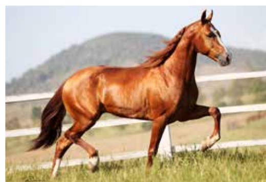
Seu pai Farrapo DN