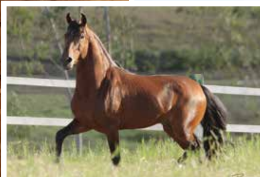
Prenhês por Emblema E.A.O em 21/01/2017