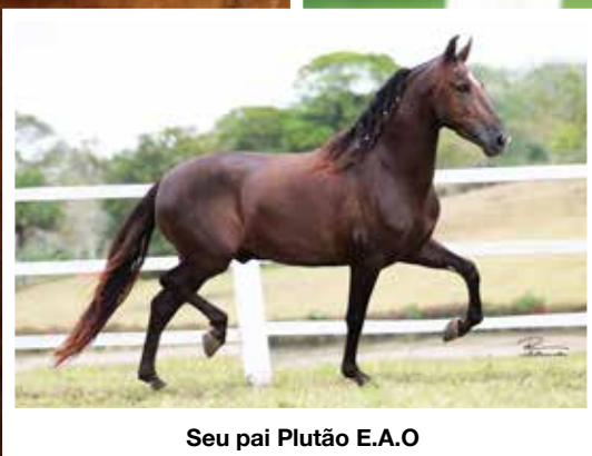
Seu pai Plutão E.A.O