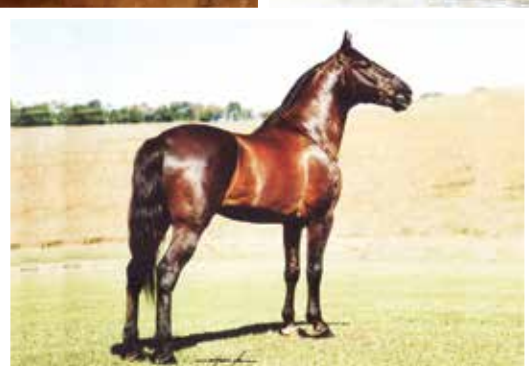
Seu pai Trilho da Zizica