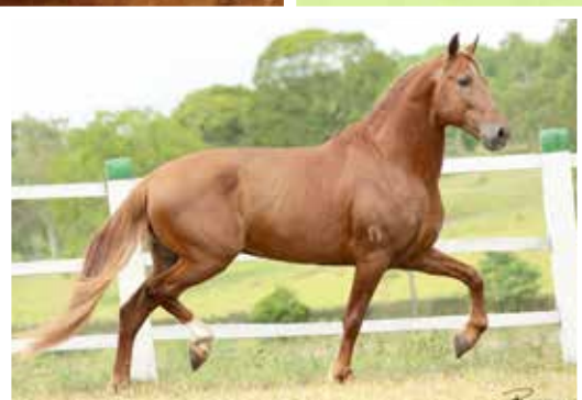
Seu pai Legat E.A.O