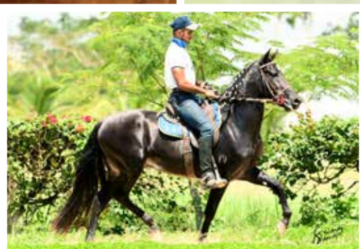
Seu filho Rebelde E.A.O