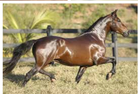
Seu avô Jogo JB