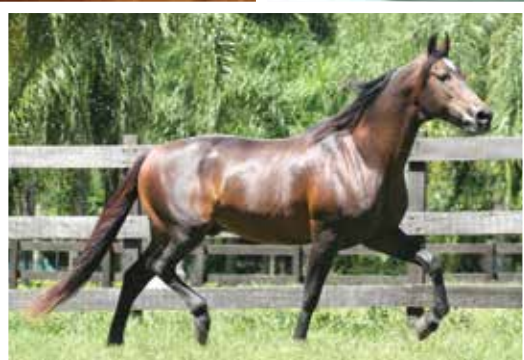
Seu avô Cabuçu da Selva Morena