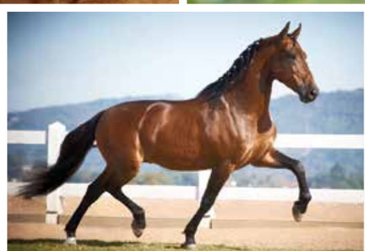
Seu pai Tigrão Kafé