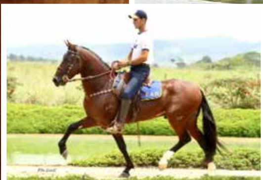
Seu pai Laredo do Paraíso