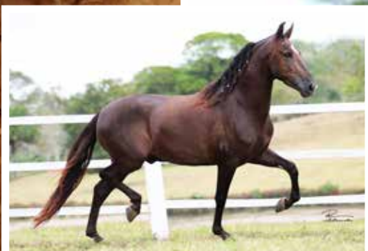
Seu pai Plutão E.A.O