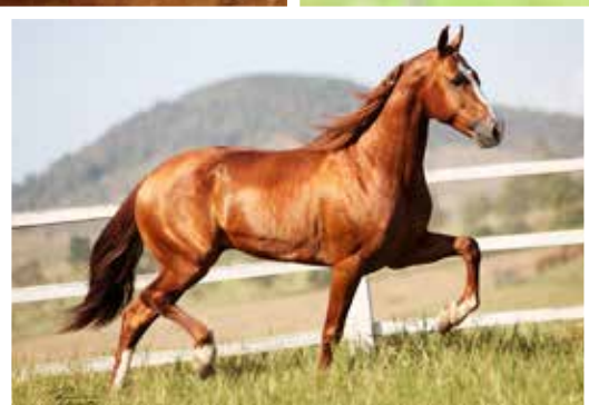
Prenhês por Farrapo D.N em 20/02/2017