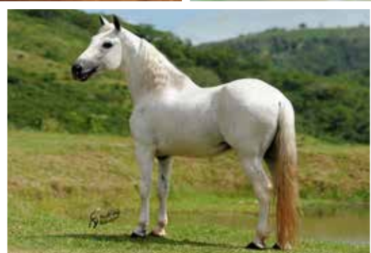
Seu pai Údine JB da Ogar