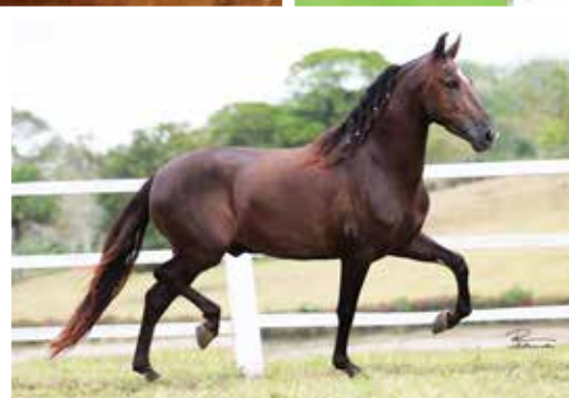
Seu pai Plutão E.A.O