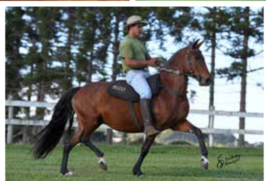
Sua mãe Levada E.A.O