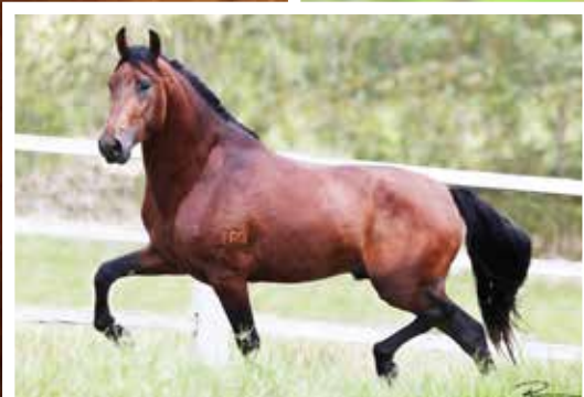
Seu pai Marechal E.A.O