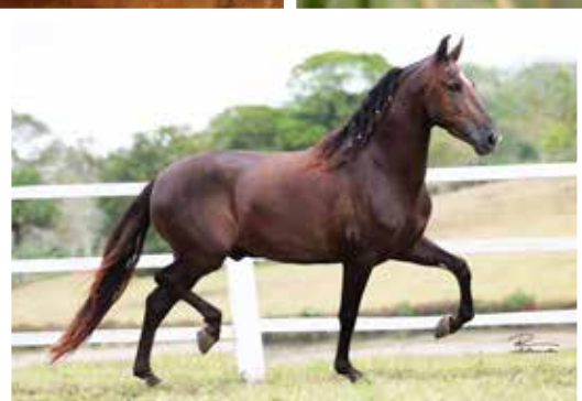
Prenhês por Plutão E.A.O em 03/11/2016