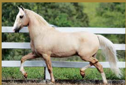
Seu pai, FAVACHO IATE