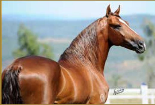
Seu pai, VIOLEIRO DO RIOMAR