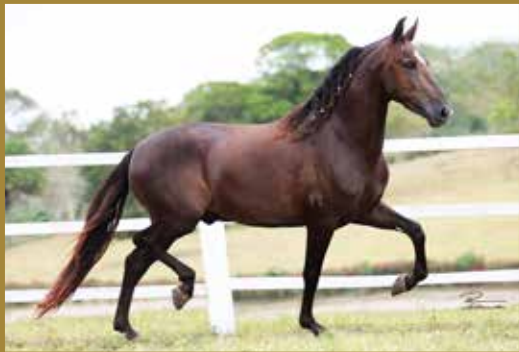
Seu pai, PLUTÃO E.A.O.