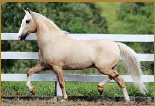
Seu pai, FAVACHO IATE