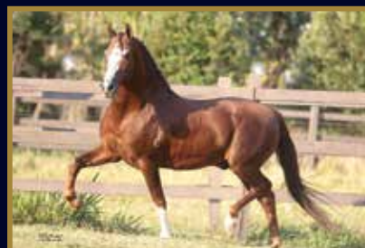
GALANTE DO EXPOENTE