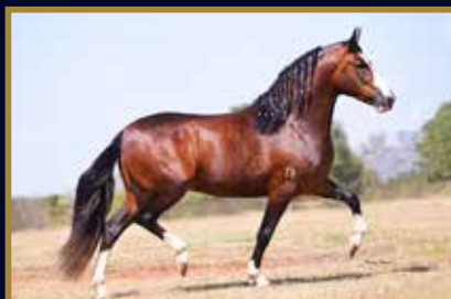
TEOREMA DA MORADA NOVA