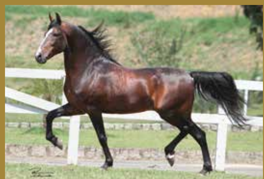
Seu pai, GUARITÁ SEARA DOURADA