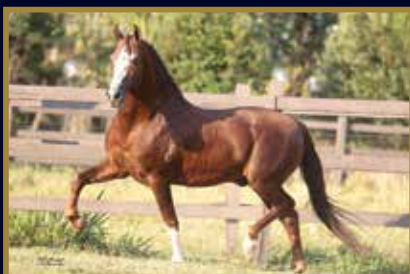
GALANTE DO EXPOENTE