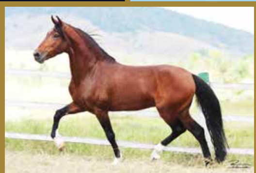
Seu pai, EMBLEMA E.A.O.