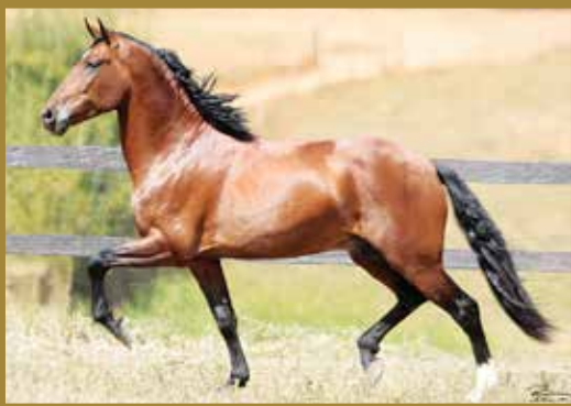
Seu pai, AGADEZ DO QUOCIENTE