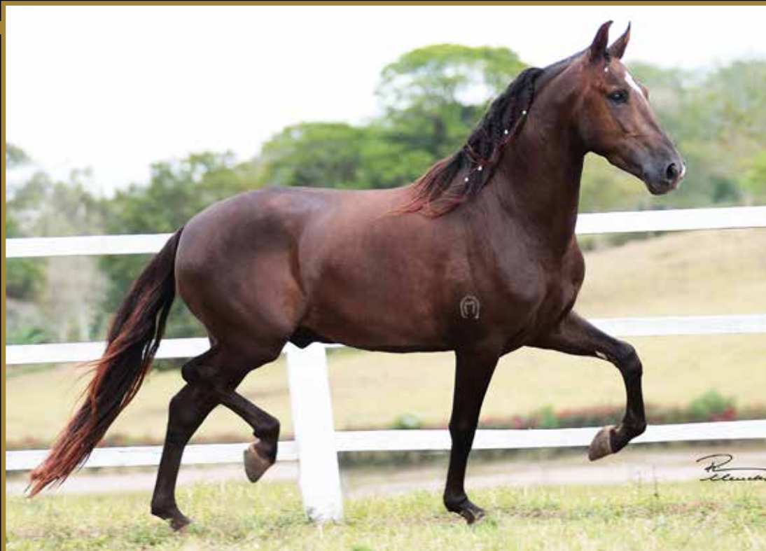
PLUTÃO E.A.O. TIGRÃO KAFÉ X SAPOTI DO AEROPORTO