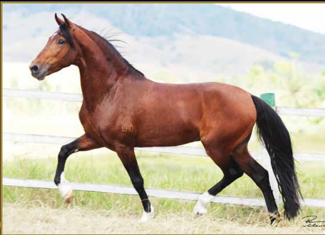
EMBLEMA E.A.O. FAVACHO QUOCIENTE X FAVACHO DAMA