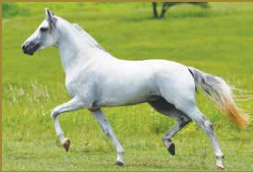
Seu pai, NÓ DO PORTO PALMEIRA