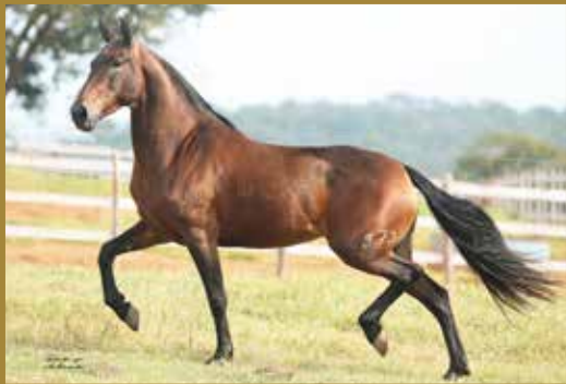
Sua mãe, SAPUCAÍ DO PORTO PALMEIRA