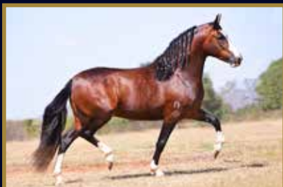
TEOREMA DA MORADA NOVA