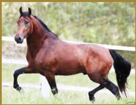
Seu pai, MARECHAL E.A.O.