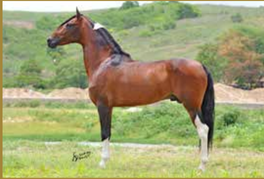
Seu pai, UNIVERSO MARIMBÁ