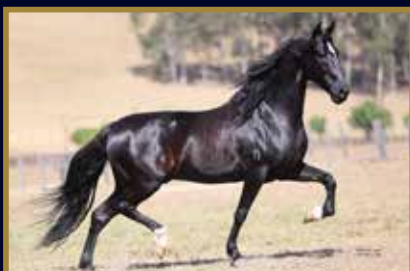
EL NEGRO DA CACHOEIRA