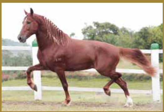
Seu pai, LEGAT E.A.O.