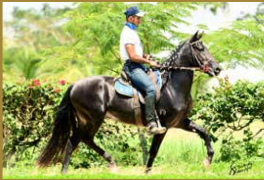
Prenhês por, REBELDE E.A.O. PARA MARÇO 2018