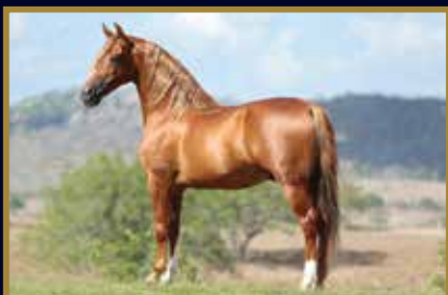
ESTANHO DE ALCATEIA