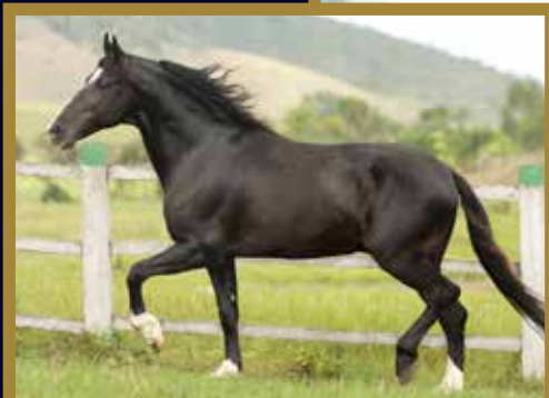
Seu pai, TURISTA DE SANTA LÚCIA