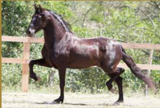
Seu pai, JABUTI DA MANDASSAIA