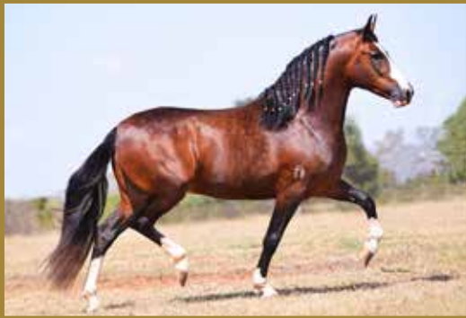
Seu pai, TEOREMA DA MORADA NOVA