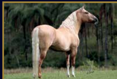
FATOR DA CAVARU RETA