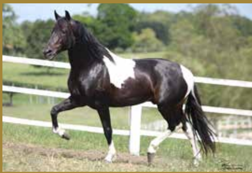
Seu pai, EXTRATO DO MINATTO