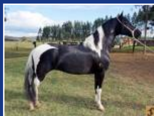
HÉRCULES DA ESCADINHA

A possibilidade de nascer pampa desse acasalamento é de 75%, sendo que metade pode ser pampa de tordilho e outra metade de cor sólida.