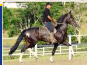
TORINO MARIMBÁ - Pai