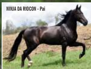
NINJA DA RIOCON - Pai